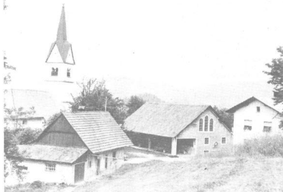
Samotorško vaško jedro: se bo vas le dokopala do telefona?