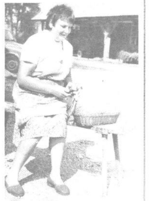
Klekanje je tudi na Samotorici eden najljubših konjičkov