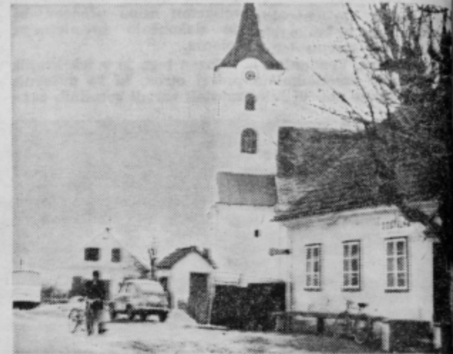
Trnovska vas leži na poti med Ptujem in Lenartom

možjo armade, ptujске občine in ostalih lahko asfaltira-