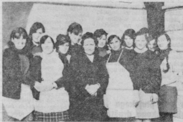
Dekleta imajo zelo rada gospodinjski pouk