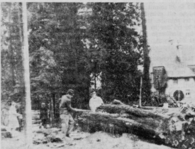
Stari kostanj je pokopal pod seboj staro zgodovino Ormoža in grajskega tihožitja v ormoškem parku.

prihodnjem tednu obrnili na odgovorne forume v Ormožu ter skušali zvedeti, komu gre do ta dejanja v čast in ponos. Morda zamisel niti ni tako kritična, kot jo jemlje-