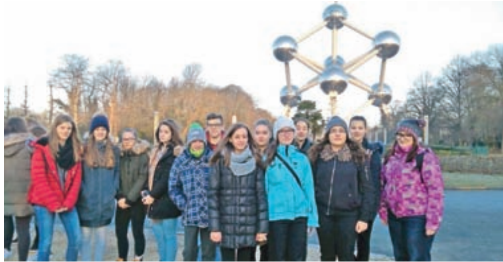
Skupinska fotografija pred Atomiumom