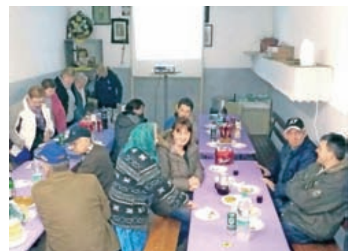
Vaščani smo se zbrali Pr' Ocvirk.

jih starih fotografij na diapozitivih. Vsaka od družin je imela nalogo, da poišče svoje stare in najbolj zanimive fotografije. Nekatero od teh so bile resnično zelo stare. Da bi vse skupaj malo popestrili, smo vsako fotografijo pokomentirali in se ob tem dodobra nasmejali. Naše druženje je trajalo dobri dve uri in pol. Po uradnem delu je sledila pogostitev in kot se za Prešernov praznik spodobi, smo praznični dan zaključili s kozarčkom sladkega vinca.