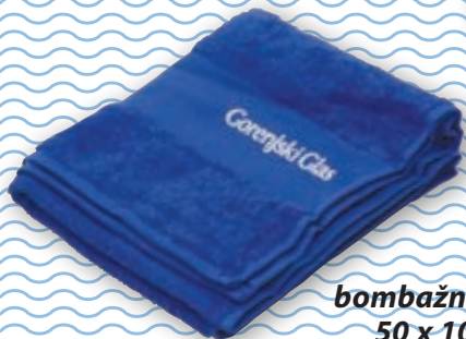
bombažna brisača 50 x 100 cm