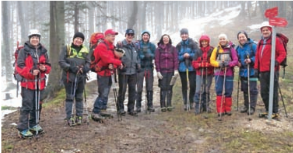
Planinski vodniki na izobraževanju na sedlu v Kisovcu

Marca se začenja nova alpinistična šola. Od tistih, ki jih to zanima, se pričakuje, da imajo že določena planinska znanja in izkušnje in da so stari vsaj 18 let. Več pa lahko izvedo na spletni strani AO Kamnik ali na uvodnem sestanku, ki bo 16. marca v prostorih Planinskega društva Kamnik na Šutni 42 v Kamniku.