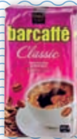
kava Barcaffé 250 g