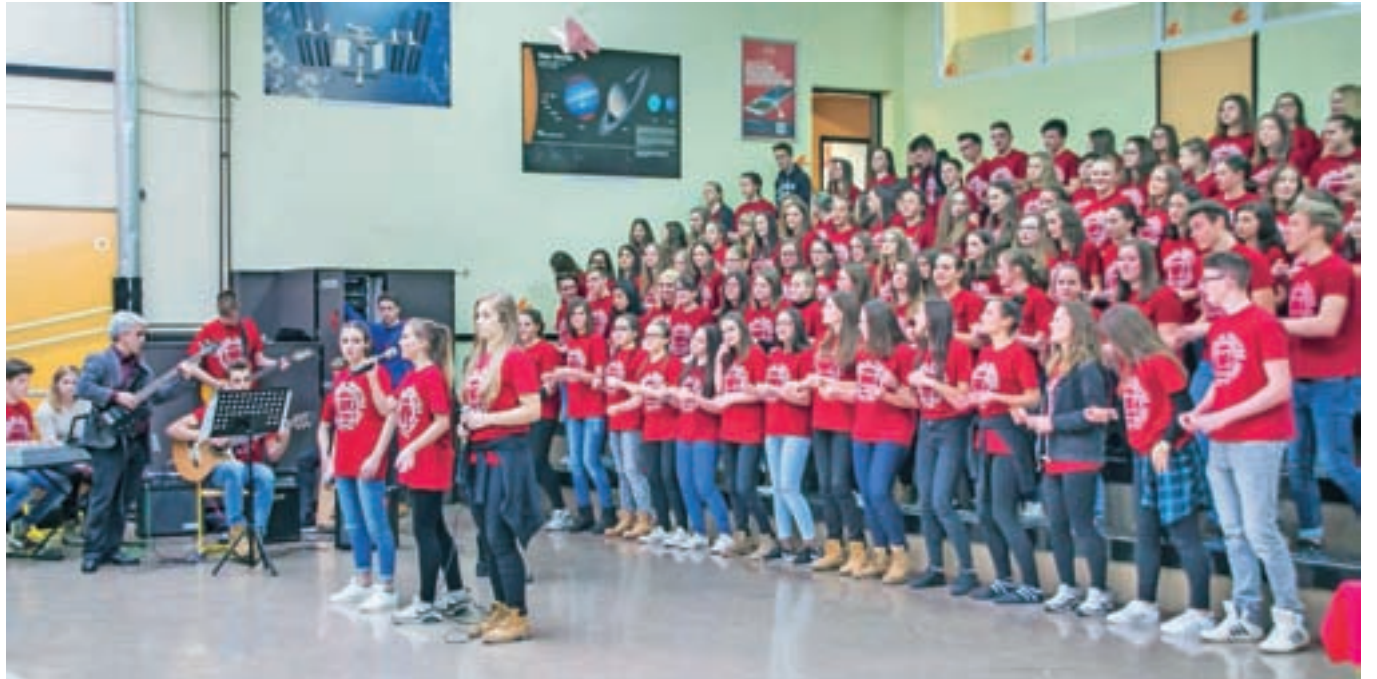
Odziv in številnost obiska osnovnošolcev in njihovih staršev sta bila na vseh treh dogodkih informativnega dne na GSŠRM zelo dobra in v skladu s pričakovanji šole.

GSŠRM odlikujejo inovativno učno okolje, pester nabor učnih programov, vrhunski dosežki dijakov, številne obšolske dejavnosti, prijazno šolsko okolje, strokovnost zaposlenih. Vpetost v lokalno okolje zagotavljamo s povezovanjem z vrtci, osnovnimi šolami, podjetji, občino in drugimi, je bilo moč slišati na informativnem dnevu, ravnateljica pa je v imenu sodelavcev še posebej poudarila: »Strokovnost zagotavljamo s strokovno odličnostjo, izkušnjami in predanostjo delu. V svoji prilagodljivosti sledimo potrebam okolja in se nanje ustvarjalno odzivamo. V duhu teh vrednot vzgajamo svoje dijakke, njihovo nemirno odraščajočo energijo pa