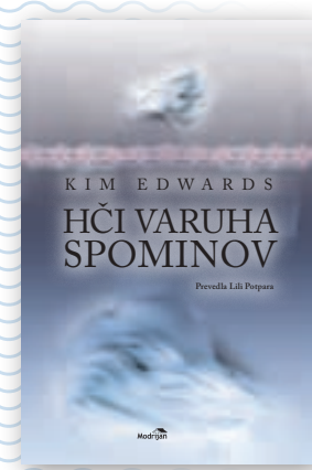
roman Hči varuha spominov

Popust in darilo veljata le za fizične osebe. Daril ne pošiljamo po pošti. Količina daril je omejena.