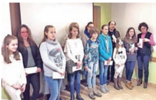
Skupinska fotografija sodelujočih na letošnjem literarnem natečaju

Ob jubilejnem 10. Literarnem večeru bodo v Termah Snovik prihodnje leto izdali tudi priložnostno zbirko pesmi, prispelih na vseh deset natečajev.