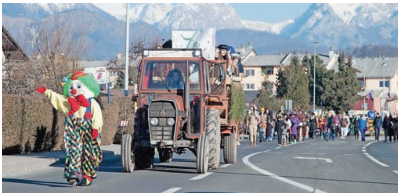
Maskare v lanskoletnem sprevodu na Duplici, kjer bodo pustno rajanje pripravili tudi jutri.

Vrhunec letošnjih pustnih dogodivščin v občini bo znova Kamniški karneval, a priložnosti za razkazovanje in rajanje bo za maskare še veliko več.