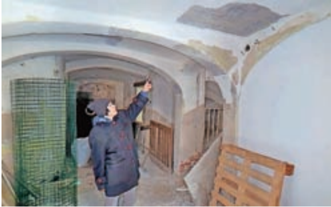
V notranjosti hiše se v konservatorskem smislu skriva pravi zaklad.