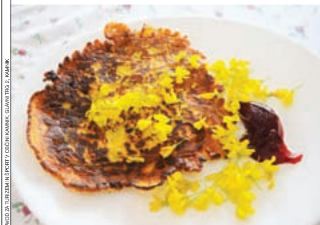
ZAVOD ZA TURIZEM IN ŠPORT V OBČINI KAMNIK, GLAVNI TRG 2, KAMNIK

Recepte že pozabljenih jedi pošljite na naslov TIC Kamnik, Glavni trg 2, 1241 Kamnik, lahko pa jih osebno prinesete vsak dan od 9. do 16. ure. Zraven pripišite kraj in ime gospodinje, ki je po tej recepturi pripravljala lokalno kamniško jed. Vsak recept bo nagrajen s kuhalnico Okusi Kamnika.