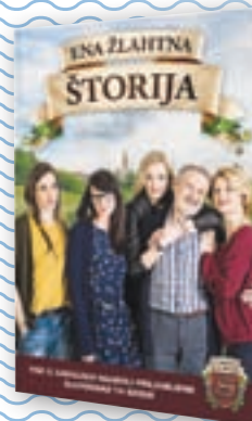
knjiga Ena žlahtna štorija