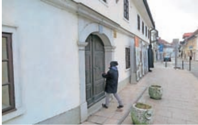
Z odkupom dodatnih prostorov bodo v hiši lahko uredili tudi glavni vhod.