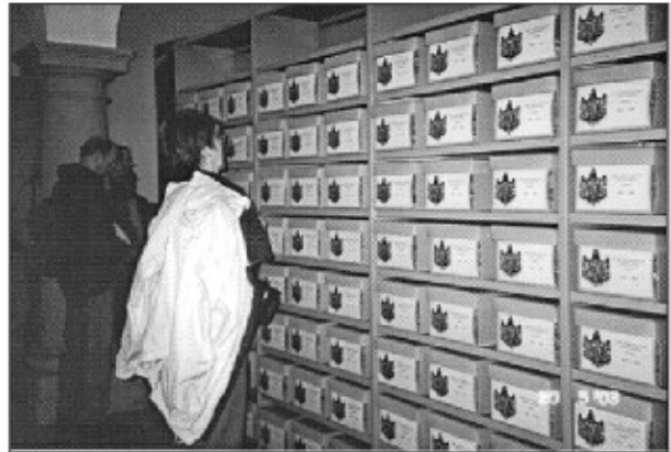
Marta v arhivu knežje družine Thurn und Taxis (Nemčija, 2003).

stožci, zgodnjekrščanske cerkve, podzemno mesto Kaymakli), Hatušaš, Ankara, Carigrad, Brnik.