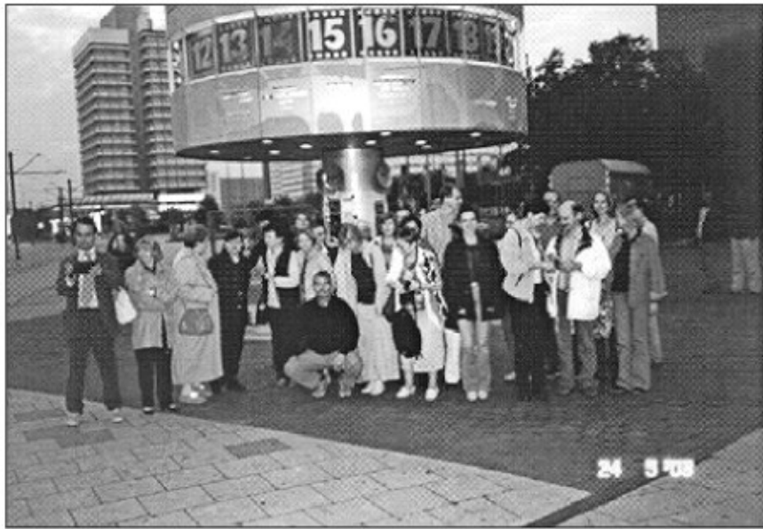
Pod svetovno uro v Berlinu (Nemčija, 2003).

Gotovina, Vesna: Strokovna ekskurzija na Nizozemsko (od 6. julija do 12. julija 1993) , Obvestila Arhiva Republike Slovenije 1993/IX, št. 2, str. 14–17.