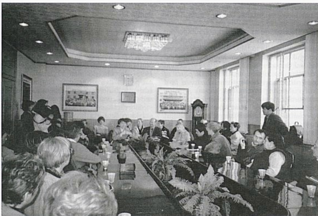
V pekinškem arhivu (Kitajska, 2000).