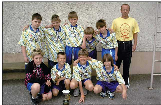
Ekipa OŠ Mladika

Končni vrstni red: 1. OŠ Grajena, 2. OŠ Mladika, 3. OŠ Makole, 4. OŠ Laporje.