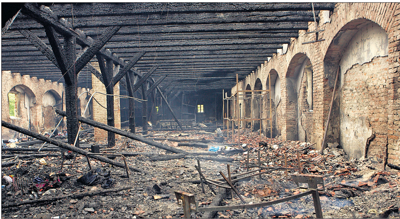
Pogorišče skladišča Karitasa

Ko smo prispeli na požarišče, smo zahtevali pomoč ostalih gasilskih društev iz mestne občine Ptuj. Po približno 15 minutah je prispelo še sedem vozil s približno 45 gasilci. Požar smo aktivno gasili tri ure. Na pogorišču so ostala še manjša žarišča, ki pa smo jih gasili do 8. ure zjutraj. Ko smo prispeli na požarišče, je bilo objekta, ki v dolžino meri okrog 55 in v širino 20 metrov, že 80 odstotkov v ognju. Ta objekt je, razen zunanjih zidov, v notranjosti v celoti iz lesa. Ko smo prispeli, je bil ogenj tako razširjen, da je že prebil streho. Omeniti pa moram tudi, da smo na prizorišču prispeli v štirih minutah po tem, ko smo prejeli obvestilo. Kljub hitremu posredovanju objektu več ni bilo pomoči, uničena pa je tudi vsa oprema, ki je bila v njem,” je o posredovanju gasilcev pri gašenju po-