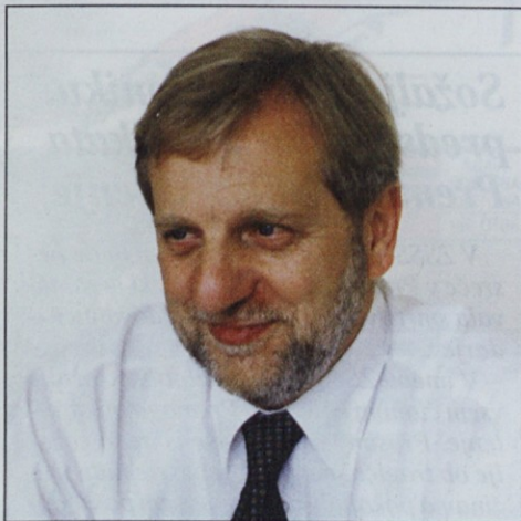
Piše: Gregor Miklič, izvršni sekretar ZSSS