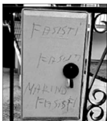
Nesramna zapuščina nočnih mazačev