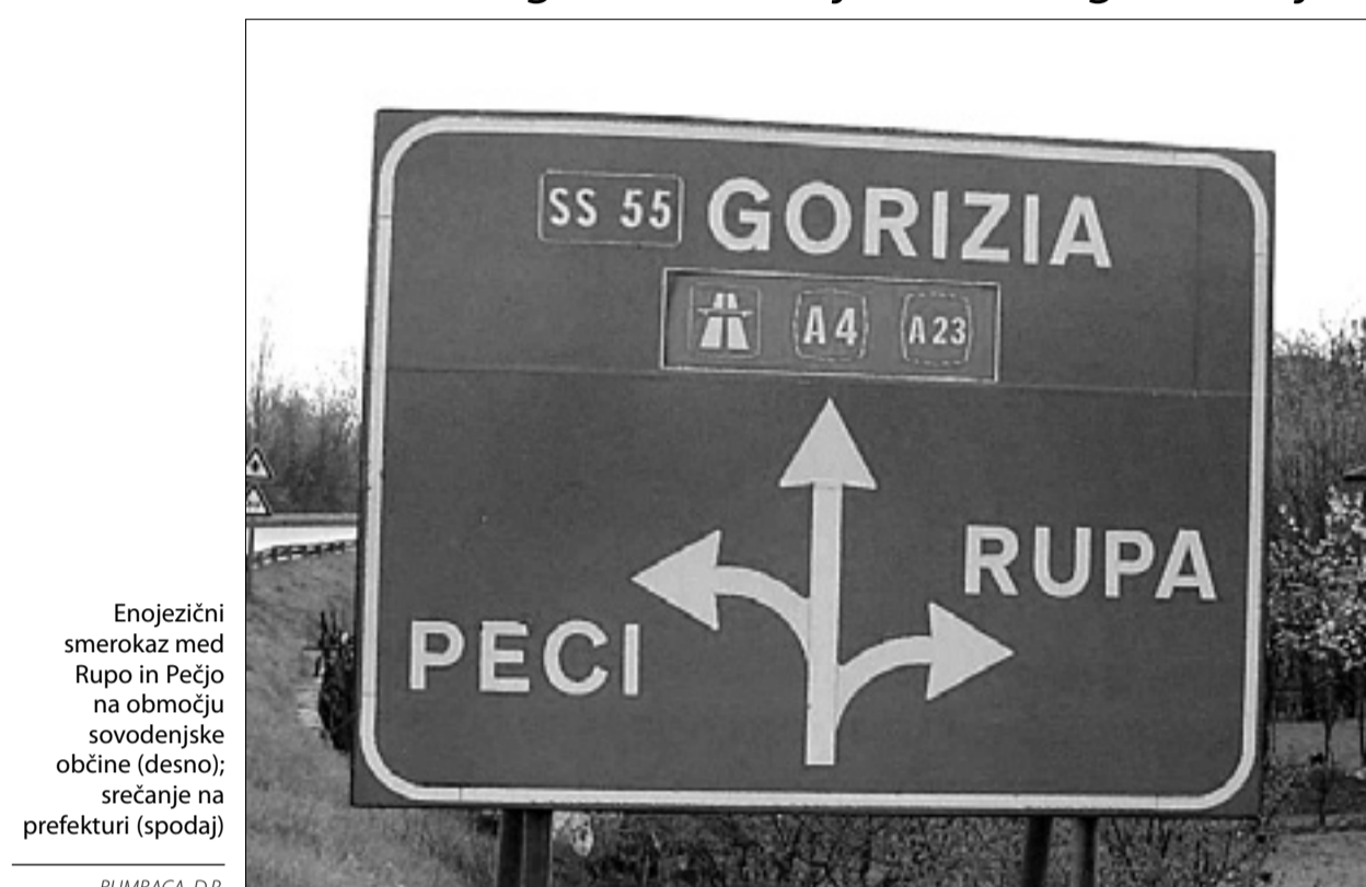
Enojezični smerokaz med Rupo in Pečjo na območju sovedenske občine (desno); srečanje na prefekturi (spodaj)

Med srečanjem na goriški prefekturi je direktor podjetja ANAS Ferrara pojasnil, da sicer že imajo pripravljen plan nameščanja dvojezičnih smerokazov na celotnem cestnem omrežju, ki spada v občine, kjer se izvajajo določila o vidni dvojezičnosti. Strošek za namestitve dvojezičnih smerokazov znaša en milijon evrov, za pripravo plana pa so funkcionarji preverili, kako je to vprašanje urejeno na Južnem Tirolskem - tudi glede na spoštovanje prometnega zakonika. Glavno oviro tako danes predstavlja pomanjkanje finančnih sredstev, saj ima podjetje ANAS