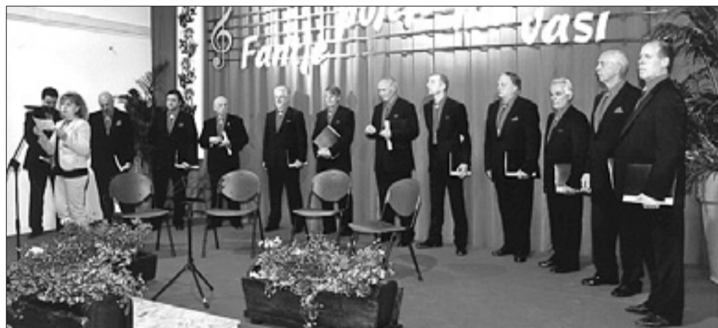
Vokalna skupina Lipa iz Bazovice

Nastopata oktet Lip z Bleda in moška vokalna skupina Lipa iz Bazovice