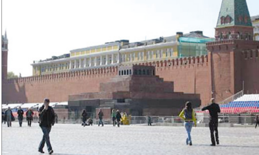
Leninov mavzolej v Moskvi z balzamiranim Leninovim truplom vsako leto obišče veliko ljudi