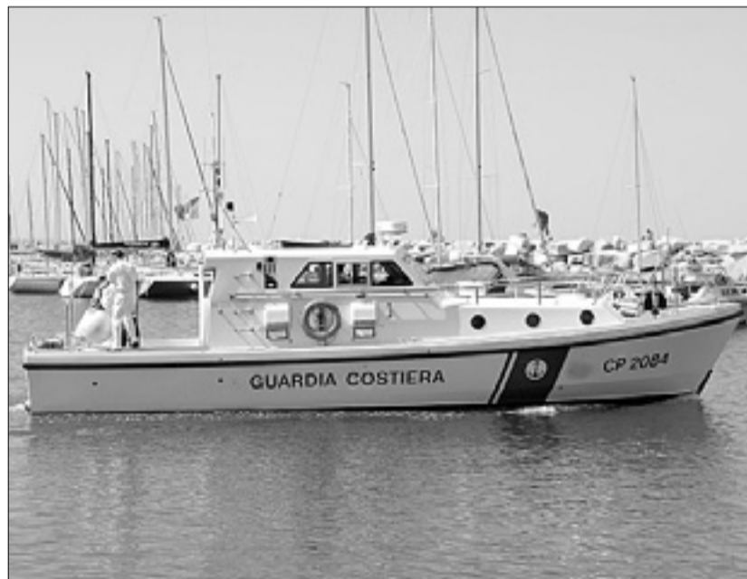
Obalna straža v grljanskem portiču