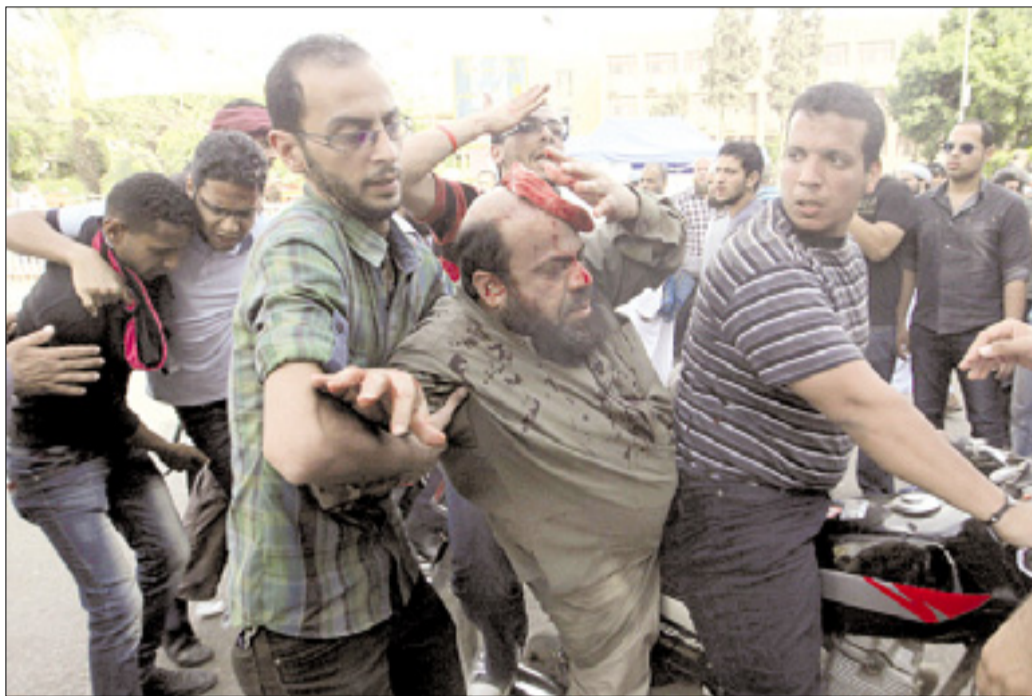
Prizor z včerajšnjih hudih spopadov v Kairu

Zborovanja se je udeležila tudi Muslimanska bratovščina, ki ima največjo poslansko skupino v parlamentu. V Egiptu bodo 23. maja predsedniške volitve, vladajoči vojaški svet pa je obljubil, da se bo po njih umaknil iz politike. (STA)