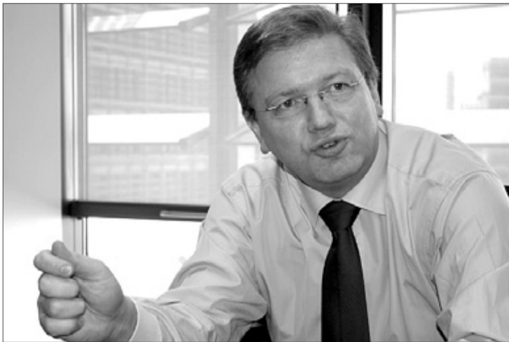
Evropski komisar za širitev Štefan Füle