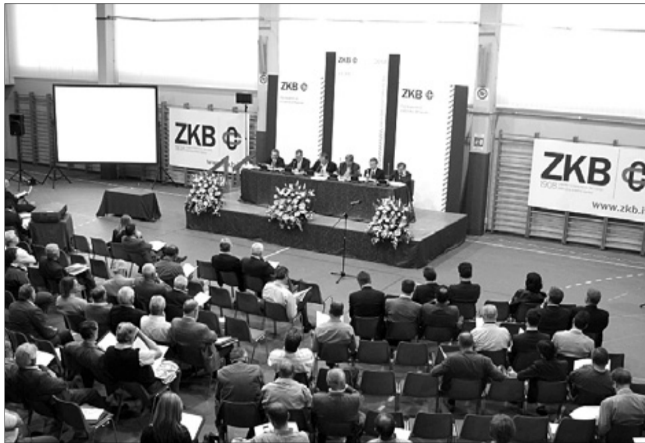
Udeleženci sinočnjega občnega zbora Zadružne kraške banke v Športno-kulturnem centru v Zgoniku

Skupne vloge so lani zrasle za 3,9 odstotka glede na leto 2010, kar je posledica povečanja neposrednih depozitov za 2,9 odstotka in posrednih depozitov za 7,2 odstotka. Ob upoštevanju tržnih razmer je mogoče rast neposrednih depozitov (+2,9%) oceniti kot zelo dober rezultat, še posebno v primerjavi z ostalimi združnimi bankami v deželi, med katerimi se ZKB po rasti neposrednih vlog uvršča med najboljše.