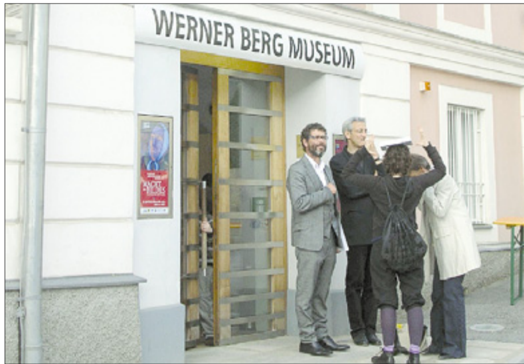
V Pliberku so odprli letošnjo osrednjo razstavo treh vidnih predstavnikov avstrijske moderne

V Pliberku odprli razstavo treh vidnih predstavnikov avstrijske moderne