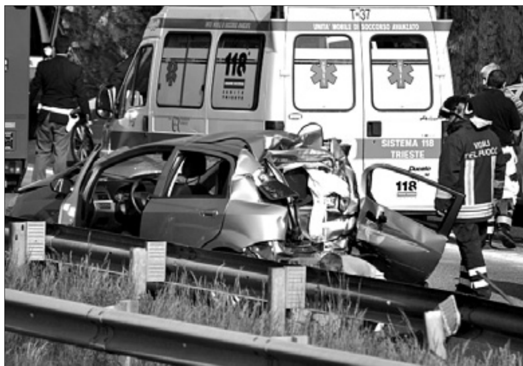
Avtomobil je bil po trčenju s tovornim vozilom in ograjo uničen

Voznica avtomobila fiat punto s pordenonsko registracijo in njena okrog deset let stara otroka so jo včeraj popoldne odnesli z lažjimi poškodbami, strašno trčenje s tovornim vozilom pa jim bo gotovo ostalo v spominu. Na prehitevalnem pasu avtocestnega priključka med Prosekom in Fernetiči (v zračni liniji pa med Opčinami in Colom) je slovenski tovornjak, ki je prevažal kontejner družbe MSC, od zadaj trčil v avtomobil, ki se je zaletel še v ograjo. Službo 118 je ob 16.30 prvi poklical uslužbenec cestne družbe Anas. Prispela sta tako rešilec kot rešilni avtomobil, osebje pa je ugotovilo, da trije ponesrečenci v fiatu niso hudo poškodovani. Enega otroka so iz previdnosti potegnili iz vozila s posebnimi nosili, zaradi česar je bila potrebna intervencija openskih gasilcev, ki so odstranili avtomobilska vrata. Mater so reševalci prepeljali v katinarsko bolnišnico, oba otroka pa v bolnišnico Burlo Garofolo. Odsek je bil v smeri proti Trstu dve uri zaprt za promet: prometni policisti so opravljali meritve, Anasovo osebje pa je čistilo cestišče. Policija je dve uri preusmerjala vozila v zgonski izvoz, nastala pa je dolga vrsta. (af)