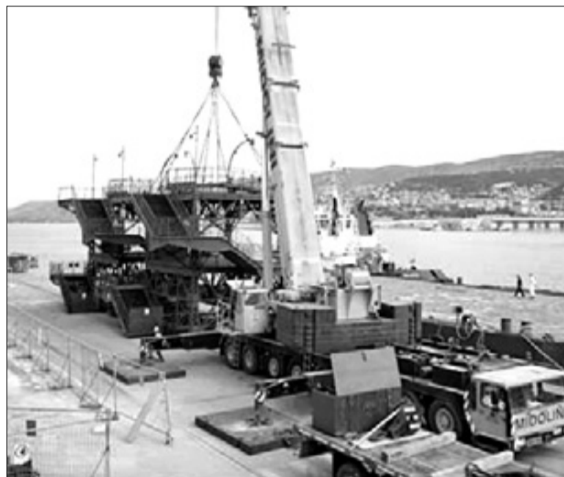
Odstranjanje brvi s pomola Bersaglieri