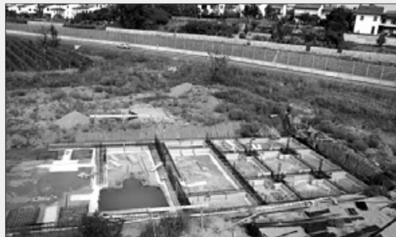
Gradbena jama je polna vode

»Kalvarija se vleče od leta 1993, ko je dozorela potreba po takšni gradnji. Lokalna skupnost je svoj prispevek dala, zemljišče, projekte in še kaj. Žal se je že ob začetku gradnje zaradi najcenejšega izvajalca in propada firme ta gradnja ustavila. V tem času pa so mladostniki postali odrasle osebe, mnogim so žal že tudi starši umrli. Kdaj bo torej ministrstvo