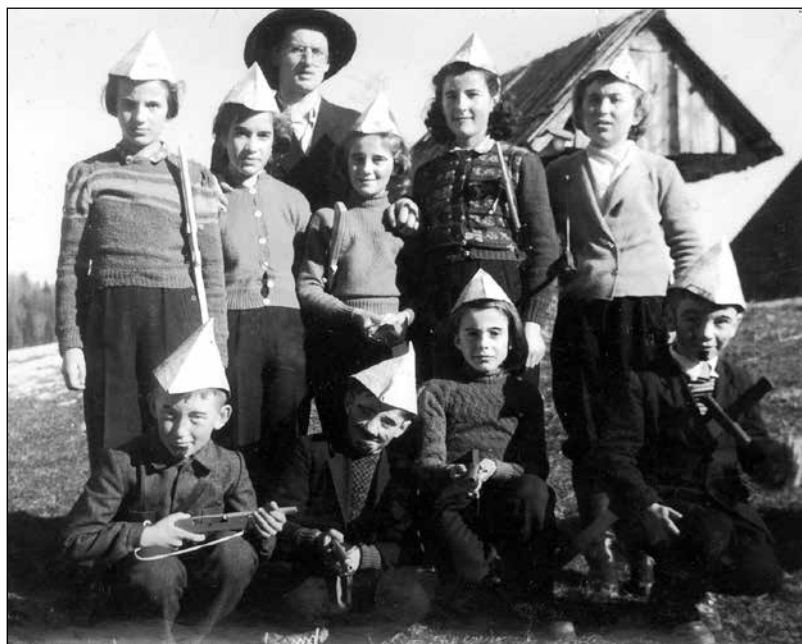
Z mladimi vojaki v Rokovnjačih.