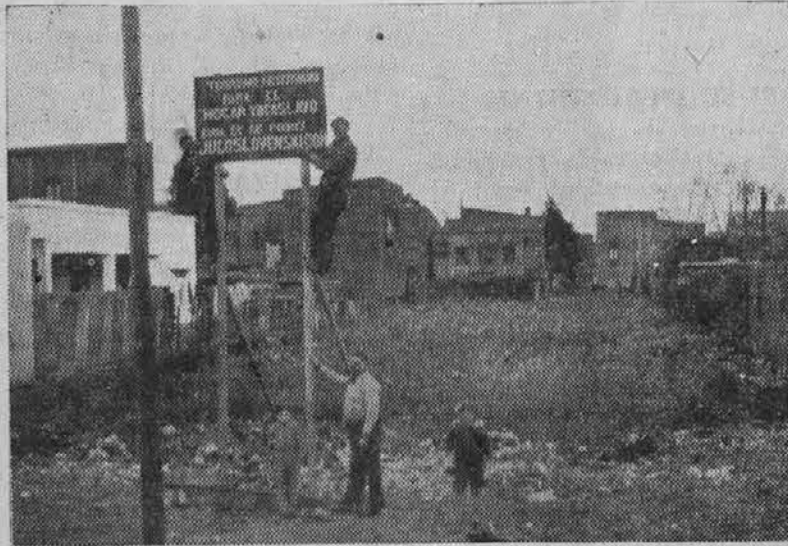
Zemljišče, kjer bo stal Jugoslovanski dom

Za to zgodovinsko slovesnost vlada med vsemi jugoslovanskimi izseljenci veliko zanimanje. Zato smo prepričani, da bodo ta dan dospeli na Dock Sud vsi pošteni in iskreni Jugoslovani, med katerimi bo gotovo tudi lepo število Slovencev iz Dock Suda, Avellanede, Boke in iz Buenos Airesa.