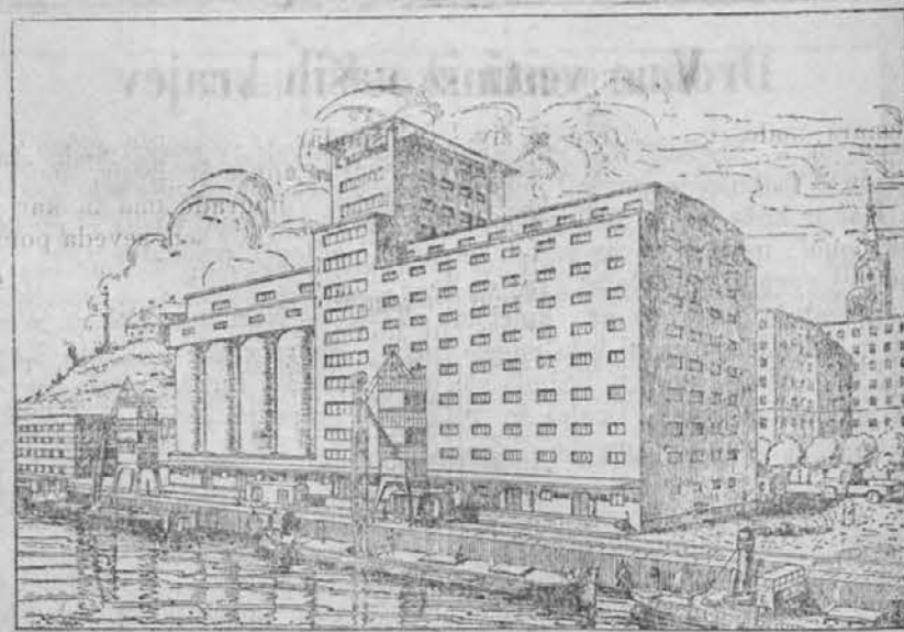
Slika predstavlja skladišče za žito, ki se jih mnogo zida v Jugoslaviji

Tako bodo Angleži počastili svoj čaj, ki ga pije že sto let, v katerih se je iz skromnih početkov razvila velika industrija, ki tisočem in tisočem daje vsakdanji kruh, da ga močno pomakati v čaj. Angleška čajna proizvodnja doseže 800 milijonov funtov čaja na leto. Prva pošiljka čaja, ki je iz Azije prišla v London pa je obsegala 8 skromnih zabojev