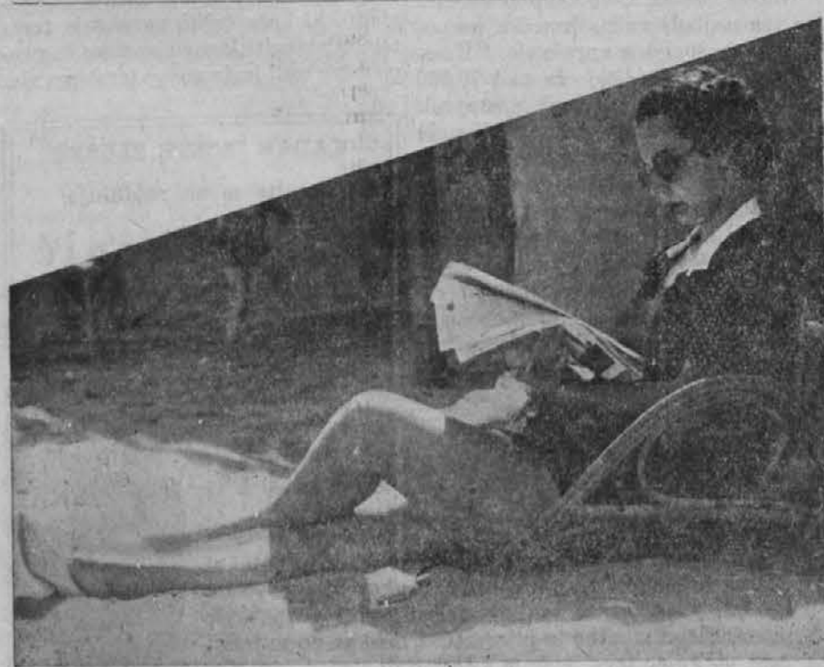
Konec letne sezone v tuki in letovišču