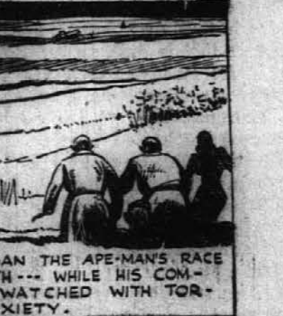
THUS BEGAN THE APE-MAN'S RACE WITH DEATH... WHILE HIS COMPANIONS WATCHED WITH TORTURED ANXIETY.