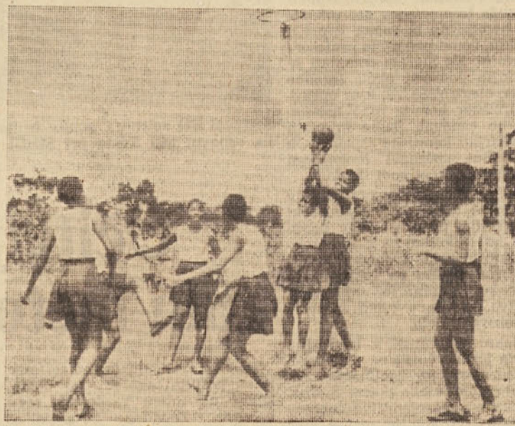
Telesna vzgoja deklet v eni ganskih srednjih šol

Koristno bi bilo, ko bi te praznine izpolnili z vrsto prilagojenih predavanj o Afriki že v tem šolskem letu. Prav tako bi bilo dobro, ko bi naši stro-