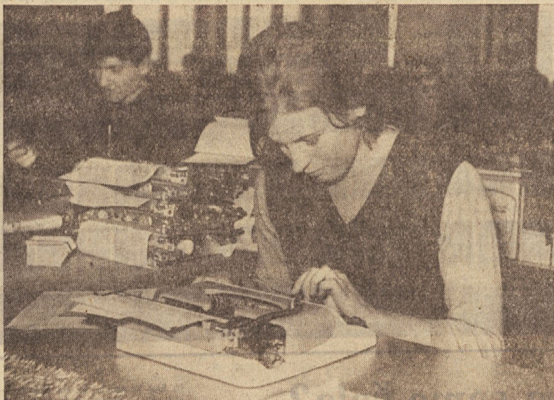
Prizor iz tovarne pisalnih strojev v Ljubljani TOPS: učenci neke šole za pisalnimi stroji

Vsem vodstvom osnovnih šol sporočamo, da vpisujemo pri Dopisni šoli tudi v splošnoizobraževalno šolo I. in II. stopnje. Smo mnenja, da je še precejšnje število takih, ki si doslej iz raznih vzrokov niso mogli pridobiti osnovnošolske izobrazbe, zato priporočamo šolam, da vse tiste, ki jih ni mogoče vključiti na večerne oddelke za odrasle, usmerijo na Dopisno šolo. Po dopisni metodi si bodo posamezniki lahko pridobili ustrezno in zaželeno izobrazbo. Podrobni napotki so natisnjeni v Navodilih za šolanje na Dopisni šoli, Ljubljana, Parnova 39