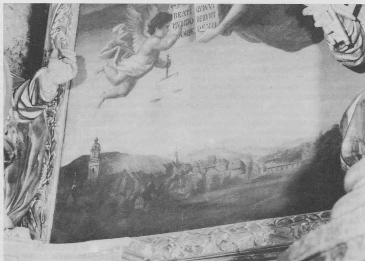
Veduta Maribora na oltarni podobi v mariborski Alojzijevi cerkvi, 1859 (na levi ob zvoniku stolnice kupola z laterno Križeve kapele)

Predvsem se obzidje na cerkveni podobi ne stika z grajsko stavbo, marveč poteka pred njo, nadalje je podprto z oporniki, Graška vrata pa predstavlja masivna utrdvena arhitektura z nazobčanim vencem, nekoliko drugačna od one na bakrorezu, kjer je pred vhodnim stolpom še utrjen barbakani. Pred obzidjem vidimo obrambni jarek, prek katerega vodi lesena brv, ob njem pa je manjša lesena kočica. Vse to se okvirno ujema tudi z grafikami. Na tej je upodobljen dvižni most z verigami, na oltarni podobi ni barbakana in dvižnih naprav, pač pa vzbudi pozornost relief nad mestnimi vrati. Relief ima okrogel okvir, v spodnjem delu mariborski grb – obzidje z mestnimi vrati in dvema stolpoma, v zgornjem delu pa figuralno skupino s sv. Trojico. Reliefa pri Vischerju ne zasledimo, pač pa sta v kotih nad portalom dve manjši dekoraciji. Mestni grad na podobi razodeva v glavnem