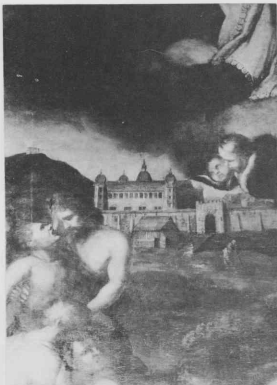
Veduta Maribora na oltarni podobi v mariborski stolnici, okoli 1716

pokrajino z obzidanim mestom in gradom. Pri površnem ogledovanju slike dokumentarnost vedute zlahka prezremo, pozornejši ogled pa nas prepriča, da gre severovzhodni vogal obzidanega Maribora z Graškimi vrati, mestnim gradom in v ozadju gradom na Piramidi. Veduta precej spominja na Vischerjev bakrorez iz leta 1681, ki nam kaže mariborski mestni grad z vzhodne strani, soočenje obeh upodobitev pa nas opozori tudi na nekatere razlike.