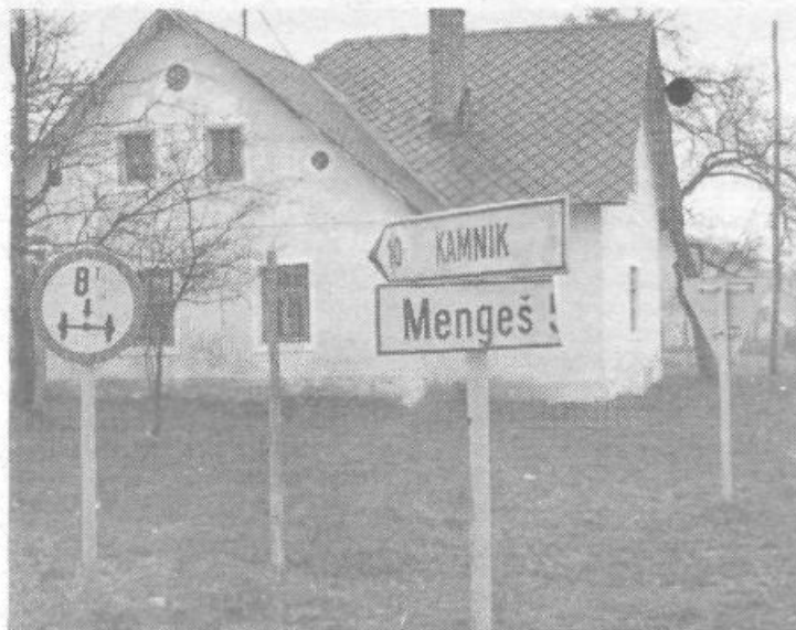
Takole razbitih in poškodovanih smerokazov je v naši občini še nekaj ducatov. Zbrali pa smo samo nekaj »vzorcev« našega vandalizma. Tam pri sosedih, kjer naj bi bila po logiki senčna stran Alp, tako uničenih napisov nimajo, zato pa imajo več zadovoljnih turistov in večji turistični dohodek.