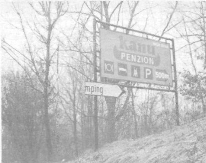
Res je, da pozimi ni veliko turistov, ki bi kampirali v Dragočajni, kjer premoremo edini prostor za te namene v občini. Zato odbiti smerokaz, ki naj bi kazal pot v ta konec, trenutno ni najbolj pomemben. Bojimo pa se, da bo takšen napis ostal tudi poleti, ko bo na sončno stran Alp prišlo nekaj več tujcev.