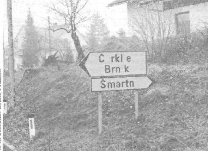
Še večje presenečenje pa vas čaka v Vodich, če boste hoteli nadaljevati pot v Cerkle ali na Brnik. Takšnega smernege napisa v Vodich ne boste našli, prav tako pa boste težko našli cesto proti Mengšu. Ob identificiranju teh napisov nam ni bilo jasno ali gre za vandalizem ali za izredno slabo izdelavo smerokazov.