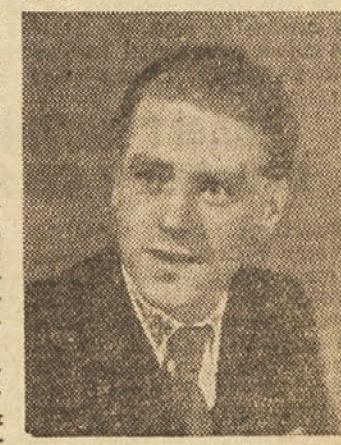
»Ta prireditelj je moj največji ponos v življenju,« nam je je deljal nagradjenec. »Iz Slovenije so me nagnali, Srbi pa me niso hoteli pustiti iz Blac niti potem, ko sem se oženil in sem se hotel vrniti v Slovenijo.«

To so skromni podatki o povprečnem prosvetnem delavcu, ki je dobil nagrado. Priča uspehom njegovega dela so tisoči in tisoči preprostitih ljudi, ki ljubijo in cenijo kulturno delo in kulturne delavce in globoko spoštujejo našega nagradjenca. Kadar govori o svojih sodelavcih na kulturnem področju, o učiteljih bivšega slovenjgraškega okraja, močno poudarja njihove zasluge: »Zelel bi samo, da vsem tem tihim in skromnim prosvetnim delavcem nudijo večji dolinski centri več moralne in gmojne podpore. Posebno pa so potrebni osebne vzpodbude za nadaljnje delo. Prosvetni delavci smo na podeželju sploh preveč odrgani od kulturnih centrov, v zadnjem času pa tudi preveč samostojni. Potrebovali bi mnogo več povezave v vidnimi prosvetnimi in kulturnimi delavci Slovenije.« Te njegove skromne želje spremlja zadovoljstvo ob uspehih celotnega bivšega Okrajnega odbora LPS, ki je znal uspešno usmerjati ljudsko prosvetno delo. In ob tem bi človek rad, da bi sielerni slovenski učitelj tudi takole ocenjal svoje uspehe desetletnega dela: »Z zadovoljstvom gledam na dobo desetih let kulturno-prosvetnega dela v bivšem slovenjgraškem kraju in sem vesel, da sem živel in delal v tem predelu!«