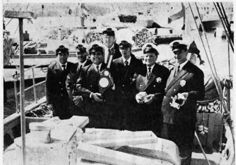
Posadka M/I »Primorka«, ki je odnesla dve priznanji

LOB podelila priznanja in simbolične nagrade 77 delavcem, ki so dvajset let neprekinjeno zaposleni v delovni organizaciji.