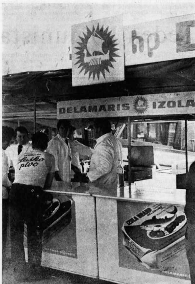
Takole je bilo pri »šanku«

bi prav lahko pekli kita, ki bolj spominja na ribištvo kot vol. Ampak je že tako, da so naši ribiči specializirani bolj na majhne ribe kot na velike. Čestokrat jih ujamejo nekaj galonov — hik — hotel sem reči vagonov. Ribiški praznik je tudi sicer bil tako pester, da se jasno spominjam