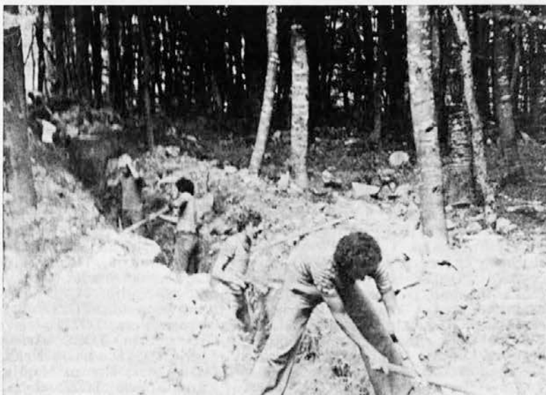
Na delovni akciji »Suha Krajina«