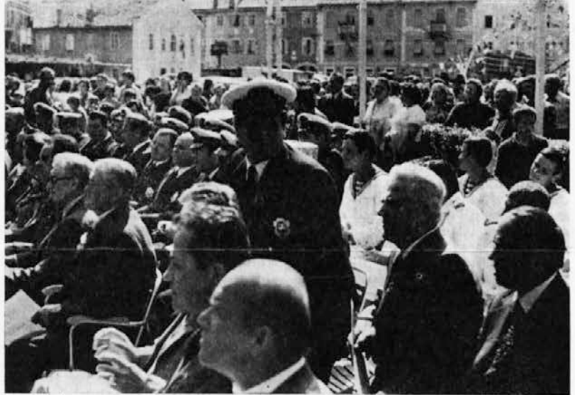
Med našimi delavci so bili tudi gostje

Osnutek zakona o združenem delu nam je bil razumljivo razložen, delavci bi lahko vprašali za dodatna pojasnila, toda ne vem, če so dovolj zainteresirani. Glede drugih stvari, ki jih delavke ne razumejo vprašajo nas in nato se mi zanimamo in jim razložimo.