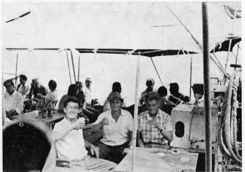
Za 4. julij Dan borca so imeli naši borci srečanje na ribiški ladji od tam gornji posnetek