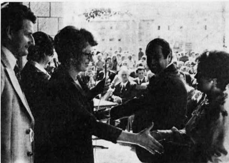
Trije 20-letniki skupaj