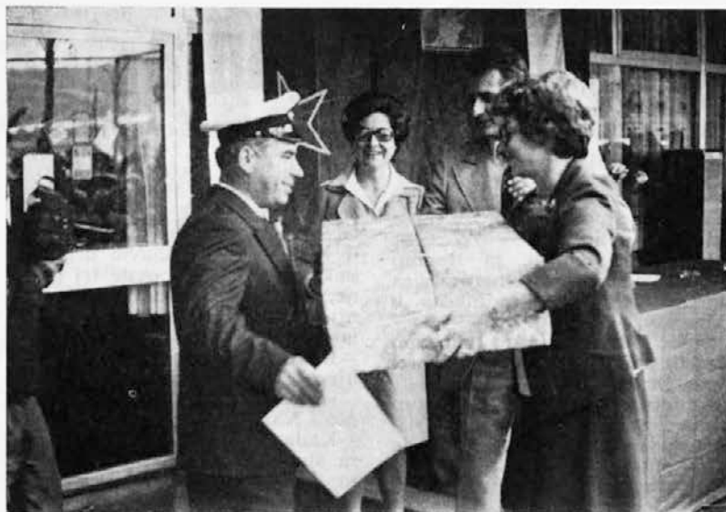
Kapitan M/1 »Sulec« prejema priznanje