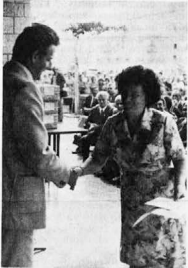
20 let dela