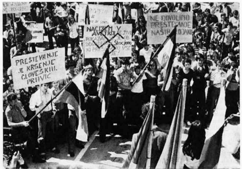
Tudi mladi iz Izole so izkazali svojo solidarnost

ta, lahko rečemo, da z rezultatom poslovanja v prvem polletju tega leta ne moremo biti zadovoljni. Tako posamezne temeljne organizacije kot tudi delovna organizacija v celoti, so poslovale z izgubo oziroma na meji rentabilnosti. Vzroki za tako stanje so objektivni in subjektivni. Prav je, da skušamo vplivati na objektivne dejavnike, ki povzročajo tako stanje, toda še bolj prav je, da se obrnemo na niz notranjih oziroma subjektivnih vzrokov, ki so odvisni od nas samih in naše notranje organiziranosti, ki se odraža tudi v nedoslednem izpolnjevanju nalog v akcijskem programu za leto 1976 in sanacijskem programu. Vodstvo podjetja nam zagotavlja, da imamo izdelane kvalitetne programe glede nadaljnega učinkovitejšega