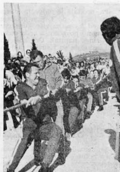
Na ribiškem prazniku so bila tudi športna tekmovanja

Naši člani kolektiva so že do sedaj izkazali solidarnost s potresnim področjem in upamo, da tudi pri nabiranju prostovoljnih prispevkov ne bodo pozabili na svoj čut solidarnosti in prispevali za pomoč Posočju.