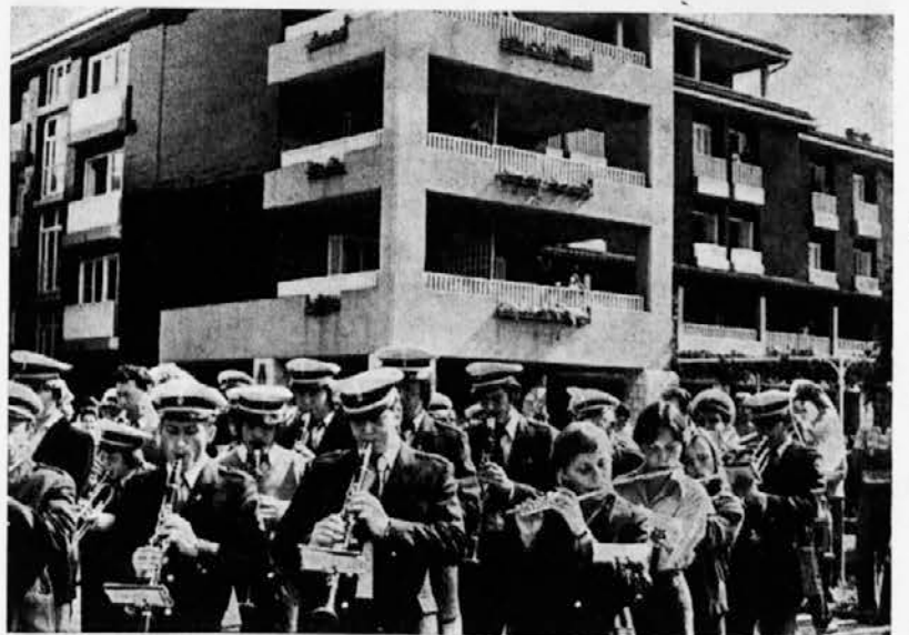
Godba na pihala

Danes tega na vaseh ni več, ljudje pa se tudi ne vključujejo v kulturne dobrine, ki jim nudi mesto ali zaradi preoddaljenosti ali pa nezanimanja za kulturo.