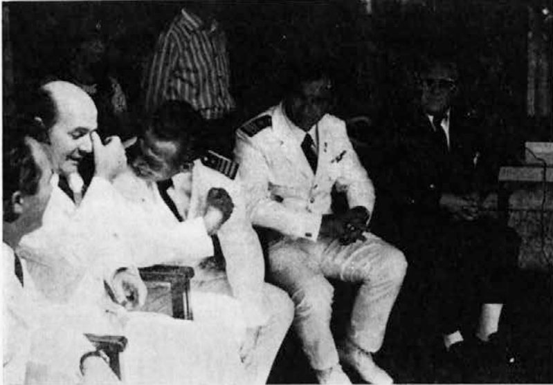
Gostje iz Pule

Me starejše delavke se med seboj razumemo, mladih pa ne moremo razumeti, saj tudi one ne razumejo kako pomembna je za nas tovarna, da v njej gledamo naš drugi dom, da nam je v najtežjih trenutkih življenja dajala kruh za našo družino. Kako sem ponosna na svoje otroke, ki so poleg osnovne šole končali še srednjo in ki z uspehom delajo na svojih delovnih mestih. Tudi to je en del zahvale, ki gre tovarni, ki nam je to omogočila, me pa smo ji vračale z delom in pridnostjo.