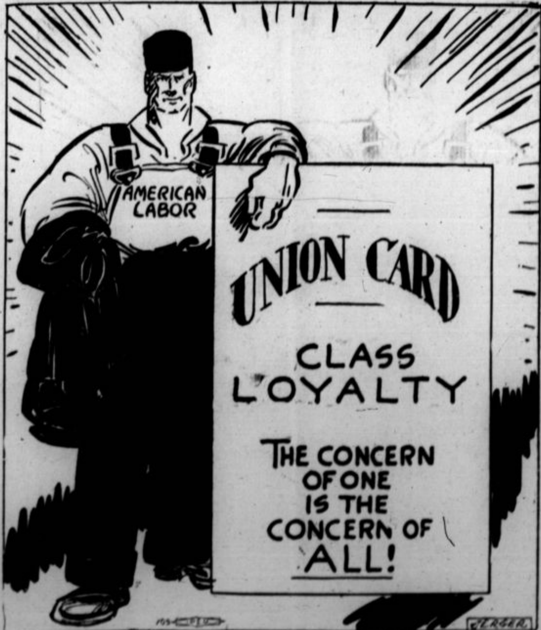
V organizaciji je moč delavstva. (Narisa! Jerger.)

O vsem tem vprašanju ni med republikanci in demokrati nobene principielne razlike. Kq je (Dalje na 3. strani.)