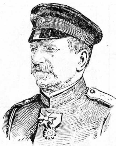
General Radko Dimitrijevič, najvišji vojskovodja bolgarske armade.

Na macedonskem bojišču je sedaj zopet razsajala ljuta vojna v najgroznejši obliki med prejšnjimi zavezniki, katerimi se je pridružila tudi Romunija, ki v zvezi s Srbi in Grki grozi Bolgarom popoln pogin. Narodi, ki so bili navidezno popolnoma izmučeni po turški vojni, so zopet zgrabili za orožje, da začno novo prelivanje krvi in vsak dan se je poročalo o večdnevih bojih in bitkah. V razne vojske so uvrstili najboljše vojake in že se je mislilo, da tega klanja