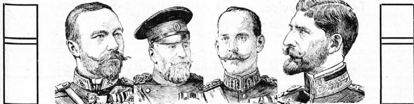
K balkanski vojni. Od leve na desno: General Ivanov, bolgarski vojskovodja; general Putnik, vojvoda srbski; grški kralj Konstantin, vrhovni vojskovodja grški; romunski prestolonaslednik Ferdinand, nadpoveljnik romunski.

ne bo taku kmalu konec, ko pride poročilo, da je bolgarska armada popolnoma poražena. Srbski glavni voditelj vseh operacij je general Putnik kot organizator in generalisimus, Bolgarom zapoveduje general Ivanov, slavni zmagovalec pri Drinoplju, nadpoveljstvo nad grško armado je prevzel kralj Konstantin sam, in romunski vojski, ki je bila pred kratkim mobilizirana, je stopil na čelo prestolonaslednik Ferdinand. Naša slika kaže vse te poveljnike v sedanji novi balkanski vojni.