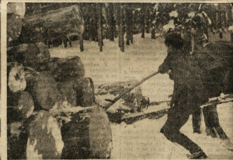
Spravilo lesa iz naših gozdov

Da pa bi odvajanje te razlike dokončno odpravili in da se začne uveljavljati svobodna cena po načelu ponudbe in povpraševanja, je potrebno, da gospodarski svet pri OLO Trbov-