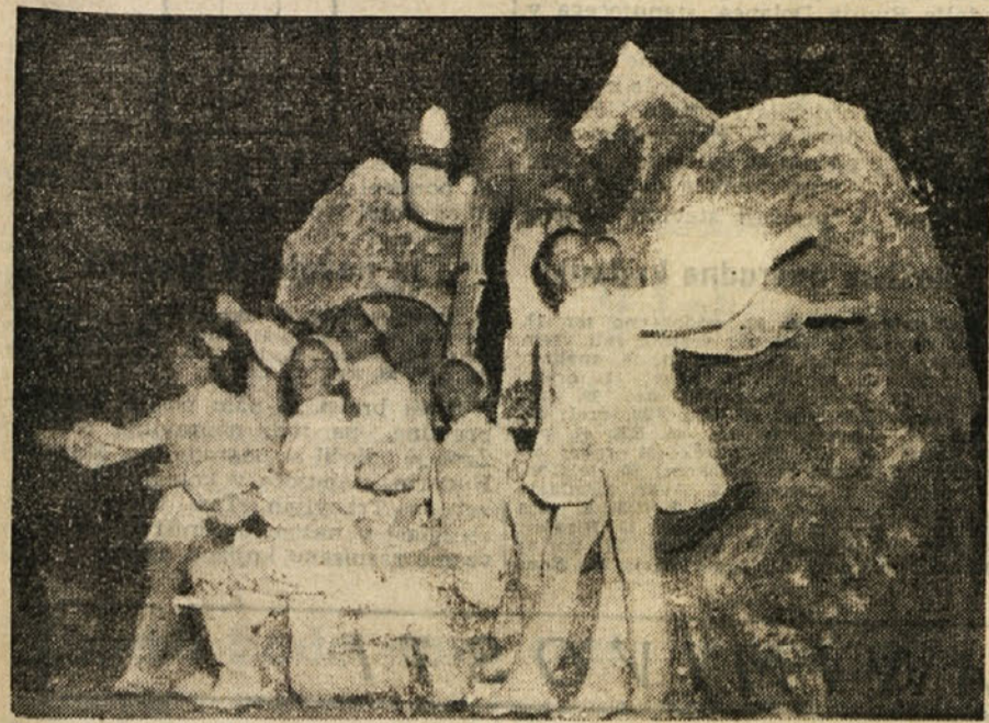
Dedek Mraz je prišel s svojim spremstvom

več parov nogavic, žepnih robcev in raznih dobrot. V bolnici so se zbrali poleg bolnikov predstavniki naših oblasti, zdravniki in osebe bolnice.