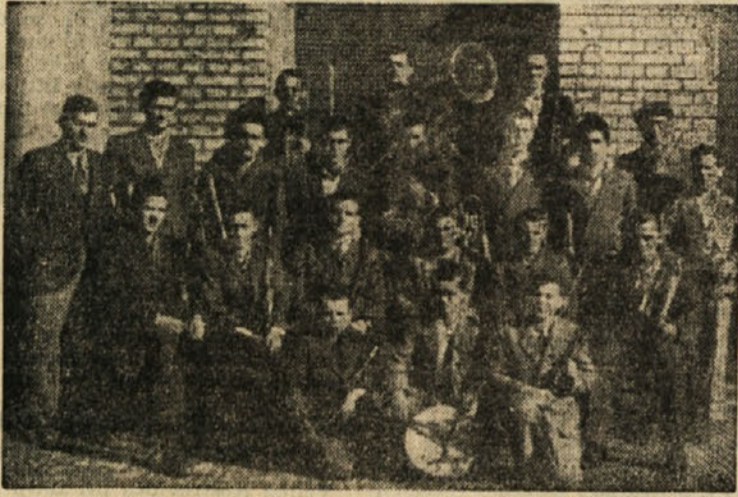
Mladinska godba steklarne Hrastnik, ki deluje v okviru Svobode II

Zato ves kolektiv upa, da bo glede na uspehe, ki jih je že dosegel (od leta 1945 je bil že petkrat nosilec zveznih in republiških prehodnih zastav), to vprašanje končno ugodno rešeno, da bo