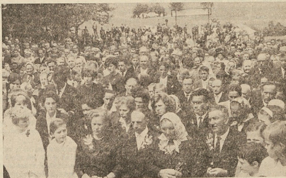
Ljudstvo pri prvi novomašniški daritvi

Dejal je, da se je zahvalil pri daritvi v gozdu za vse, kar je dobrega prejel in lepega videl, kar je ljubezni okusil. Rekli bi laže: bilo je daritveno srečanje. Liturgija kot jezik tega sestanka se je s svojo prijazno obliko dotaknila slehernega in ga pritegnila tesneje. Vtis, da je nova maša