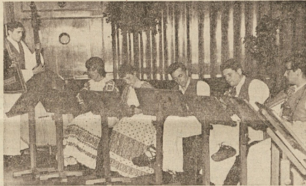
Hrvatski tamburaši iz Gradišanske igrajo na akademiji avstrijskih narodnih manjšin.

Začetek je bil pravzaprav že pri kresu na Šentjanskih Rutah. Slavnostna akademija pa je bila v nedeljo, dne 11. julija 1965, ob pol treh popoldne v veliki dvorani Doma glasbe, kjer so vsi mladinci pokazali pester spored. Najprej je zadonela pozdravna pesem zbora Koroške dijaške zveze.