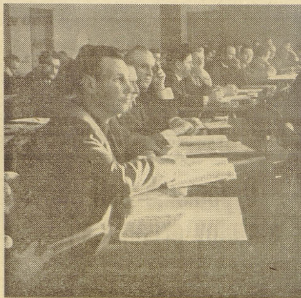
S predzadnjega zasedanja DS podjetja