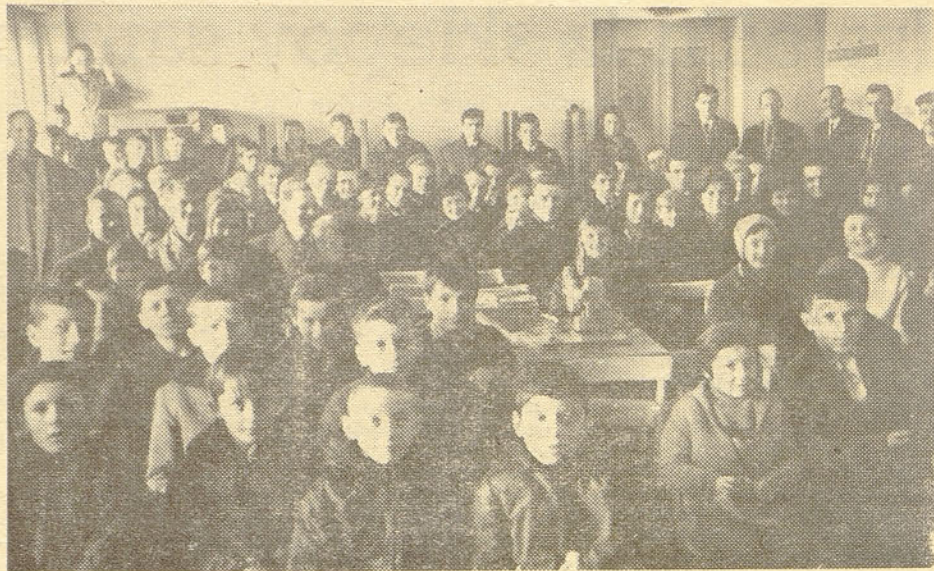
V dvorani dražgoške šole so prikazali film »Partizansko srečanje ZB ISKRE v Dražgošah«

I S K R A — glasilo delovnega kolektiva Iskra industrije za elektromehaniško telesko munikacije elektronic — avtomatiko — ure, ure uredniški odbor — Glavni urednik: Pavel Gantar — odgovorn.