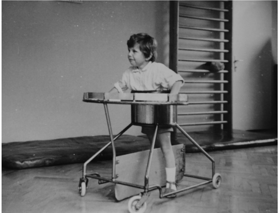
Slika 2: Starogorski voziček.

dela v začetku 70. let. Od teh je vredno omeniti sprejetje meril za bolnišnično obravnavo otrok, uvedbo nevrofizioterapije (metode po Bobathu in Vojti), izgradnjo paviljonskega sistema in ponovno združitev s šempetrsko bolnišnico. Delovati je začela ambulanta za rizične novorojenčke (kot predhodnica današnje razvojne ambulante), v naslednjih desetletjih pa tudi pedonevrološka in fiziatrična ambulanta. Uvedli so programe t. i. tedenskih edukacij in strnjenih obravnav za starše in otroke z razvojnimi motnjami ter v zadnjem desetletju še programe nevrorehabilitacije odraslih.