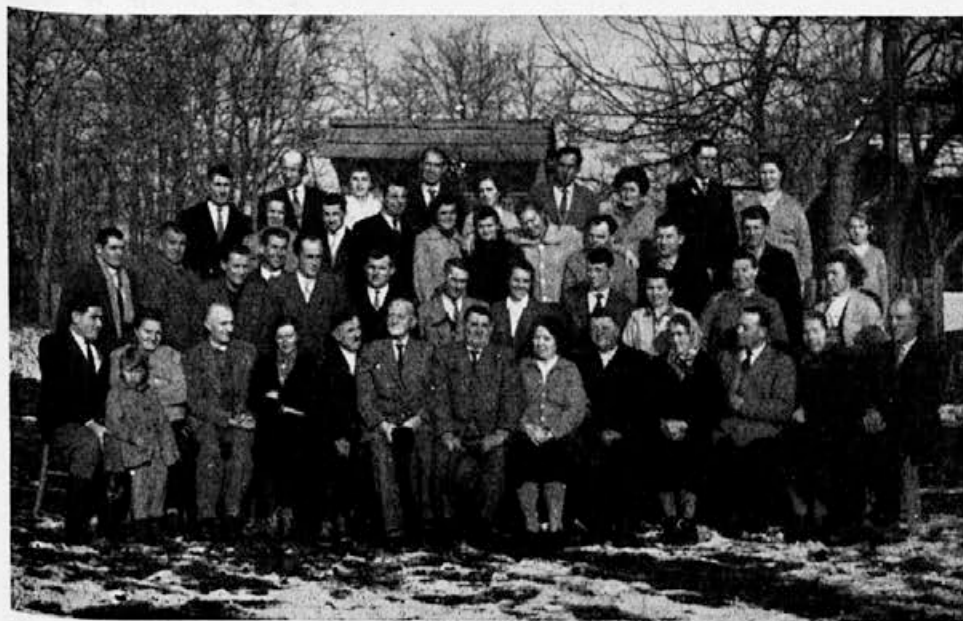
Z občnega zbora čebelarke družine v Dobovi. (Glej dopis na str. 47!)

Kdor je zazimil jeseni mlade čebele, ta spomladi sploh ne bo imel mrtvic. Če jih je kaj morda bilo, so jih čebele same odnesle iz panjev. Kadar pa bi opazili nenormalno veliko število mrtvic, takrat je po sredi najbrž kaka bolezen. Pošljimo mrtve čebele takoj v pregled! Prav pa je, da damo spomladi pregledati mrtvice iz vseh panjev. Tako se najbolje zavarujemo proti kužnim boleznim, ki nam lahko prav hitro oslabe ali celo uničijo vse čebelje družine. Bolje je boleznim preprečevati kot pa zdraviti.