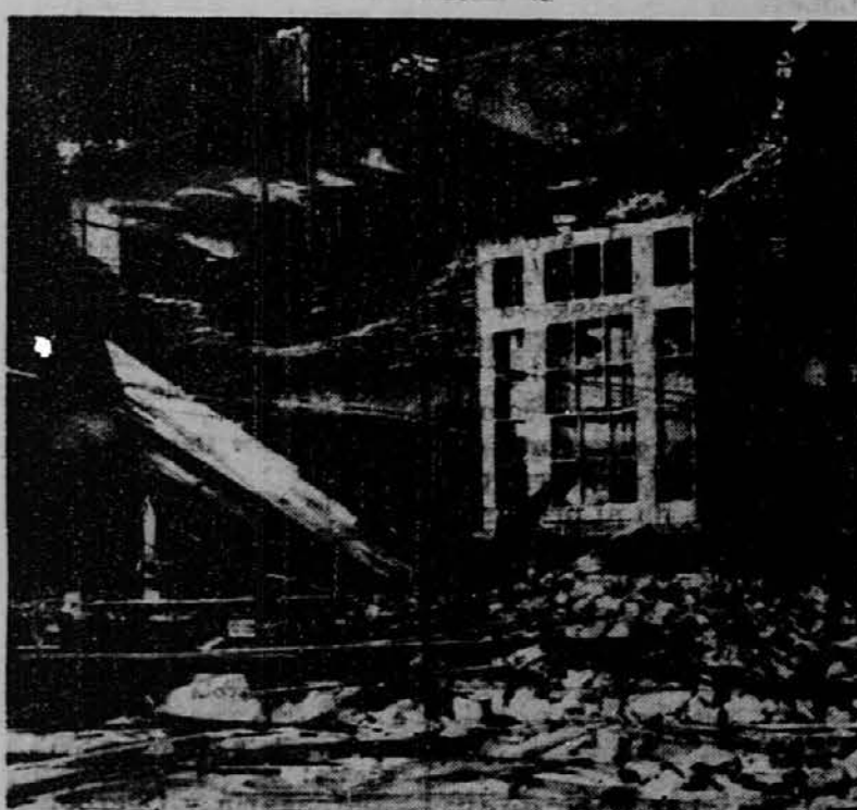
Ostanki nove šole v Gainesville, Ga., ki jo je porušil zadnji tornado. Poslopje je veljal o 50,000 dolarjev.