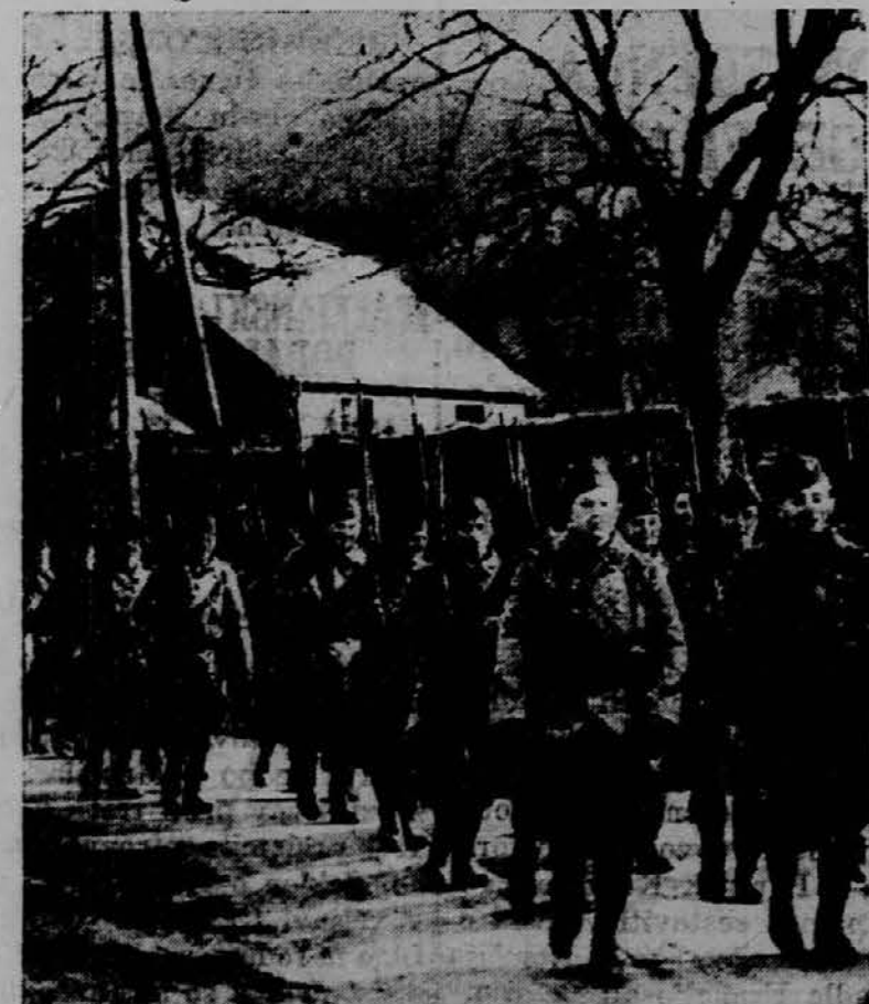
Oddelek francoskih vojakov koraka skozi mesto Matt v Alzaciji proti francosko-nemški meji, kjer že tabori 100,000 francoskih vojakov.