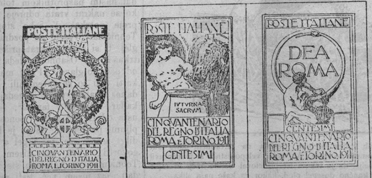
Die neuen italienischen Jubiläumsmarken.

Kakor znano, praznujemo letos v Italiji jubilej združenja in ustanovitve laškega kraljevstva. Ob tej priliki izdali so zanimive jubilejske marke, katere pri našemo v naši sliki. Marke so jako lepo ureteno izdelane. Slavnosti same so bile veličastne in tudi avstrijski parlament je laskemu za jubilej čestital. Avstrija seveda nima vroka, da bi se veselila jubileja laškega kraljevstva. Kaj s tem kraljevstvom smo dobili sosed, katerega „prijateljstvo“ je dostikrat le navidezno