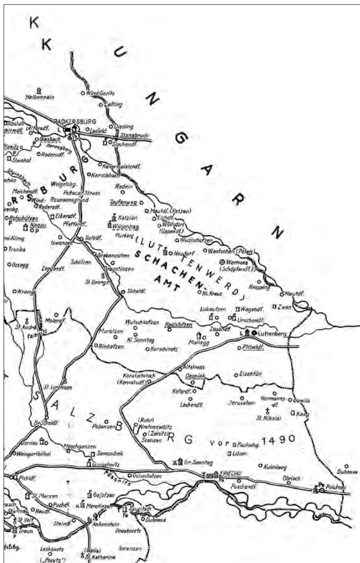
Gospstva in imenja na Ljutomerskem na prelomu iz srednjega v zgodnji novi vek (Pirchegger, Die Untersteiermark, karta v prilogi v zavihku na zadnji platnici – izsek: del karte s stanjem na območju med Muro in Dravo; https://de.wikipedia.org/wiki/Datei:Untersteiermark_Schema_der_Grenzen_und_Besitze.jpg ).

Svetokriževski vikariat pa je po Kovačiču takrat obsegal 21 krajev: Banovci, Boreci, Bučecovci, Bunčani, Gajševci, Grabe pri Ljutomeru, Grlava, Hrastje, Iljaševci, Ključarovci pri Ljutomeru, Kokoriči, Krištanci, Sv. Križ (Križevci), Logarovci, Lukavci, Mota, Nova ves, Stara ves, Šalinci, Veržej in Vučja vas. Tudi ta obseg se do ustanovitve jožefinskega vikariata Veržej ni spreminjal. 13