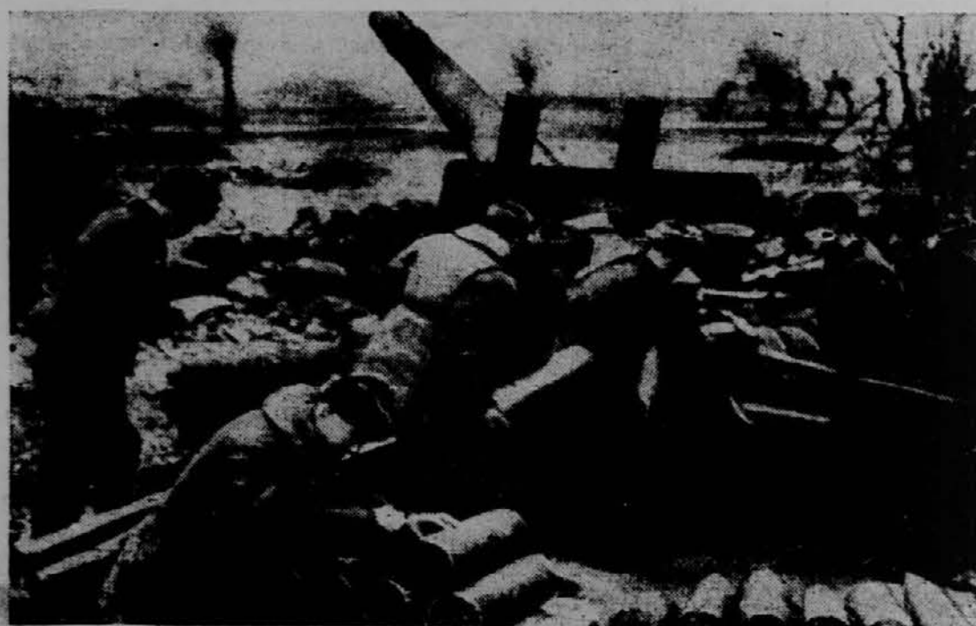
Ruski topničarji v akciji proti Nemcem v Šleziji

"Treba je bilo samo pritisniti na nek gumb neke in vse naprave bi zletele v zrak — samo Nemci gumba niso pritisnili," pravi poročilo "Pravde".