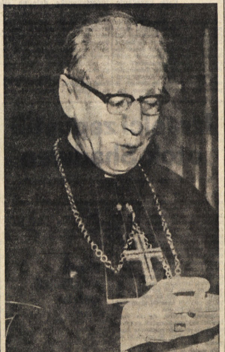
Holandski kardinal Alfrink je ena najizrazitejših osebnosti v katoliškem svetu: na 2. vatikanskem koncilu je zagovarjal najnaprednejša stališča. V kratkem se bo sestal s papežem Pavlom VI. da bi skupaj z njim rešil sporno vprašanje celibata, ki razdvaja katoliško duhovščino

o teh in drugih radijskih in televizijskih sporedih obširne barvne reportaže v «RADIOCORRIERE - TV» «RADIOCORRIERE - TV» ki ga izdaja ERI, prikazuje v času pred Sanremom obširno anketo o industriji plošč v Italiji