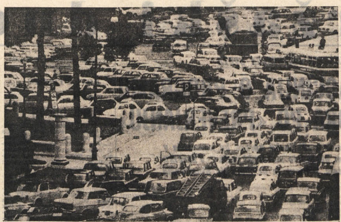
V ZDA bodo v prihodnjih letih potrebovali 10 milijard dolarjev, da bi rešili človeku prido. Odplake vode, plini iz izpušnih cevi ter iz dimnikov tovornih puščaj so seboj tako nevarne posledice, da grozi človeku v močno industrializiranih deželah popolna zastrupitev. Gornja slika nam to nekoliko pojasnjuje.

«Z vstopovitvijo delavskih svetov je bil storjen prvi korak v rušenju tej ostenji. V prvem obdobju so delavski sveti bili komaj demokratski politični instrument, s pomočjo katerega je bilo možno spremeniti materialne odnose. Naslednji korak je bila dejanska sprememba, kar je zahtevalo bistveno reorganizacijo vsega gospodarskega sistema v smislu maksimalne decentralizacije gospodarskega upravljanja. V tej fazi smo se lotili tudi sprememb v sistemu plač, s perspektivo, da postopoma uresničimo polno samoupravljanje delovnih kolektivov v proizvodnji in delitvi, omejejo samo z družbenim načrtom globalnega obsega v gospodarstvu ter s splošnimi urejvalnimi ukrepi državnih organov. V takšnih razmerah bi samoupravljanje delavcev na področju upravljanja proizvodnje moralno vedno bolj dobivati svoje konkretno materialno vsebino — prav v rezultatih na področju delitve. (Iz govora na V. kongresu SZDLJ 1960.)