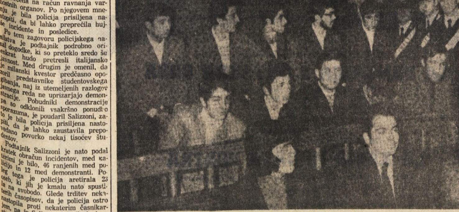
V Milanu je v teku sodna razprava v zvezi z dogodki, ki so se pripetili 19. novembra med splošno stavko. Skupina demonstrantov se mora zagovarjati pred sodiščem pod obtožbo udeležbe nedovoljenega zborovanja, nasilstva in žalitve. Na sliki skupina mladih demonstrantov na zatožni klopi