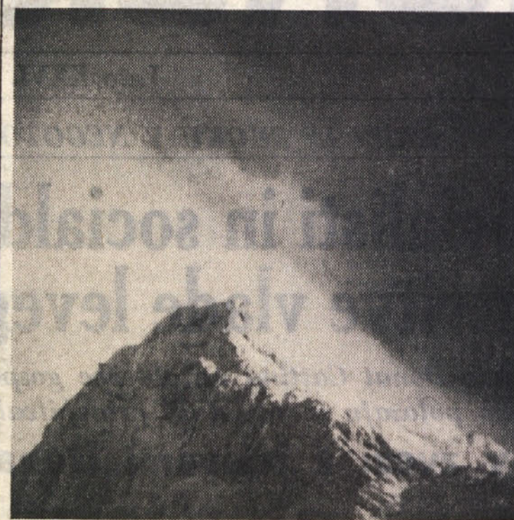
Zasneženi vrh «sivega poglavarja» Julijcev sil osamljen v nebo: sedaj je nedostopen, ker po njegovih prepripanih stenah rohijo brez prestedka plazovi