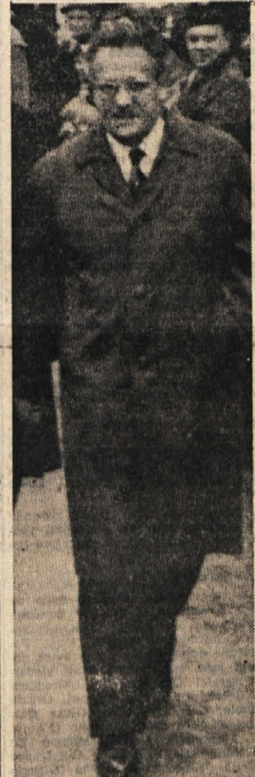
med obema deželama in ne narobe. Razume se, da so odnosi, kar krni so se med obema deželama ustvarili pozneje, imeli obratni učinek v smislu krepitve notranje političnih težej, ki so značilne za novo Jugoslavijo. Notranje in zunanje politični aspekti tega vprašanja predstavljajo torej nelodljivo celoto. Vsakdo, kdor bi skušal pojasniti specifični notranji razvoj Jugoslavije izključno kot rezultat določene zunanje politične spora, bi bil daleč od resnice in zato bi si nikakor ne mogel pojasniti niti vsebine notranje politične razvoja Jugoslavije po letu 1948.

Opiranje na najširše množice je bila ena od osnovnih značilnosti linije KPJ tako v dobi ilegale, kakor tudi v izvajanju socialistične revolucije. In to je določalo smer revolucionarne prenosne v deželi.