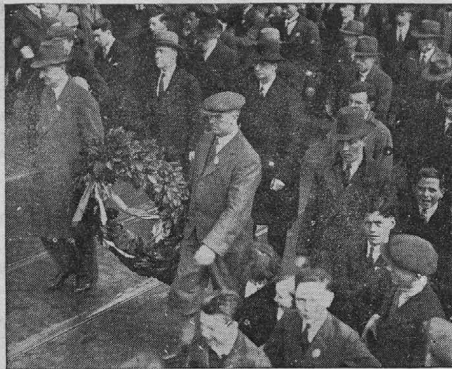
Irci v Dublinu so počastili spomin rojakov, ki so padli leta 1916 za časa vstaje proti angleškim gospodarjem.

Od takšnega temeljitega preokreta pa smo, menda, še daleč daleč.