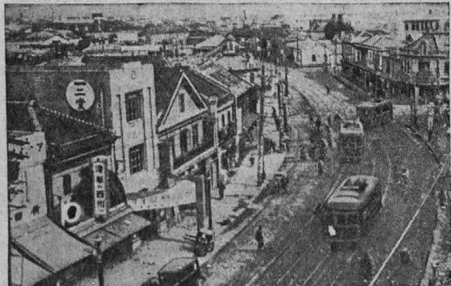
Japonsko mesto Hakodate, kjer je v kratkem presledku že dvakrat divjal požar ter ga strašno opustošil. Preko 1000 oseb je našlo smrt v plamenih Nove uniforme italijanske vojske