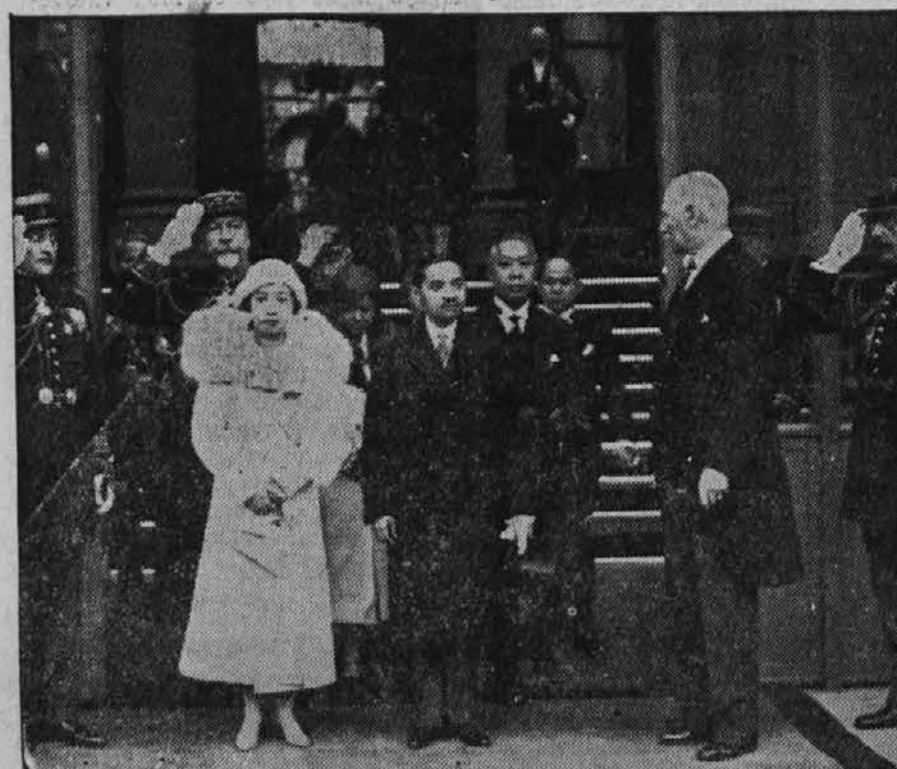
Siamski kralj in kraljica v Parizu