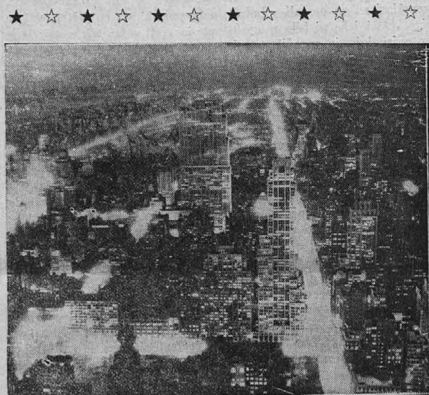
Newyorško veléemesto ponoči

V Mirnu obstoja organizacija "Opera Nazionale Fascista", ki je razglasila, da bo skrbela za brezposelne. In res je začela deliti delavcem, ki so brez zaslužka, brezplačna kosila. Toliki fašistični človekoljubnosti so se mnogi čudili, dokler niso izvedeli, kako je z njo. S človekoljubnostjo paradira in si dela reklamo fašistična organizacija, stroške pa nosi neki slovenski trgovec, pri katerem je "Opera Nazionale" naročila jestvine, ki jih sedaj noče plačati.