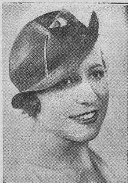
Nov model klobuka

Med navadno bledoto in tako zvanim "zdravim licem" je pa cela vrsta raznih barvnih odtenkov, po katerih more več človek precej zanesljivo sklepati na razna organsko bolna stanja pri sočloveku. Pri