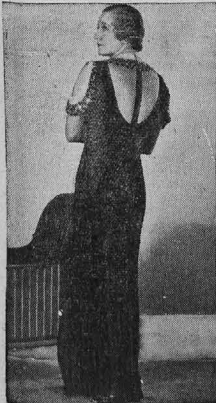
Moda v Parizu: večerna obleka