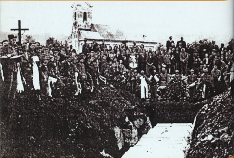
Pokop žrtev v Hrovači pri Ribnici – grčarskih in turjaških borcev.