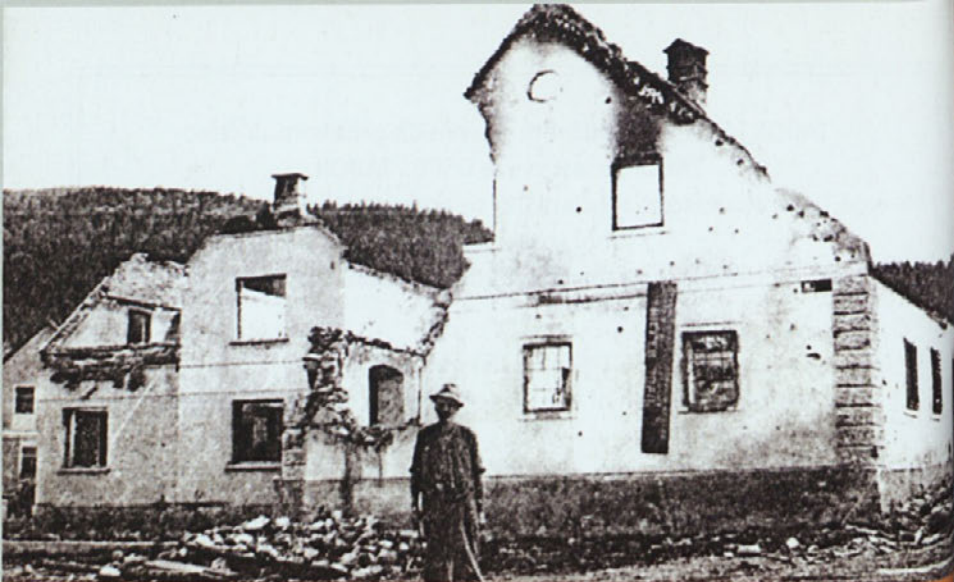
Posledice partizansko-italijanskega napada na Grčarice septembra 1943.