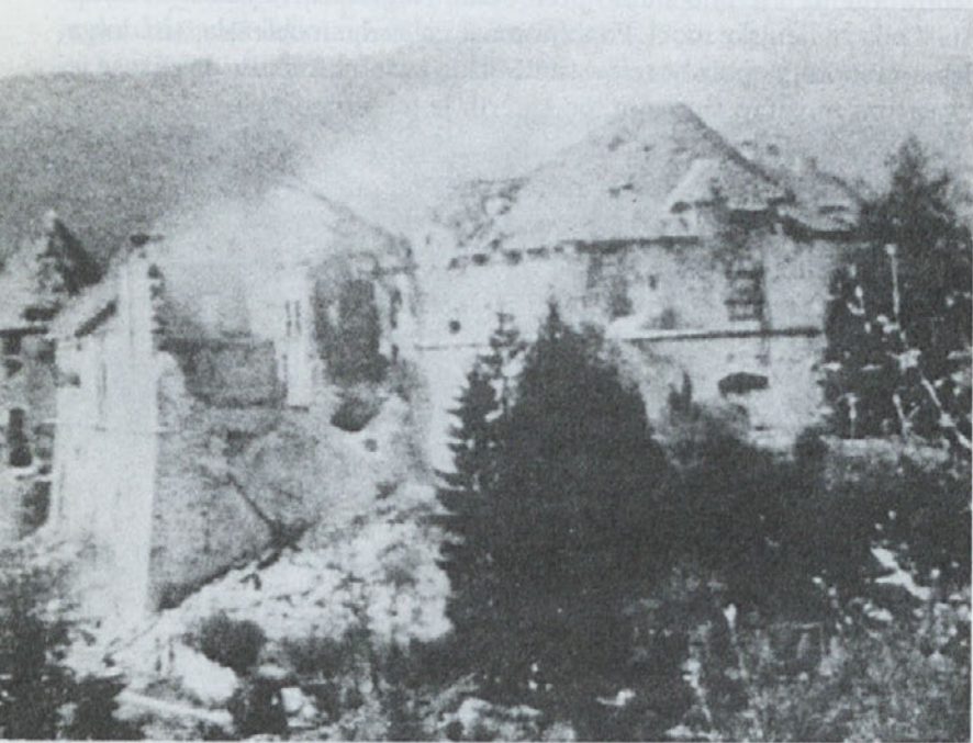
Napad partizanov in Italijanov na Turjaški grad (MNZS)

»ČE BI SOVRAŽNIK, NAŠ BRAT, TUDI SEDAJ PRELOMIL SLOVESNO DANO BESEDO O AMNESTIJI IN BI SE KOMU MED NAMI SKRIVIL LAS, TEDAJ PRISEGAMO PRI VSEMOGOČNEM BOGU, DA SE BOMO TISTI, KI BOMO OSTALI ŽIVI, KOT EDEN DVIGNILI IN NADALJEVALI BORBO PROTI VEROLOMNEMU SOVRAŽNIKU IN NE BOMO NIKDAR VEČ VERJELI NJEGOVIM OBLJUBAM.«