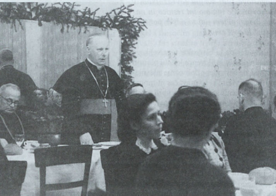
Škof dr. Gregorij Rožman tolazi begunce iz Bele Krajine, 26. XII. 1944

Škof Rožman se ni »distanciral«, ko se je to (domobranstvo) podredilo nemškemu poveljstvu. Pod nemškim poveljstvom namreč domobranci