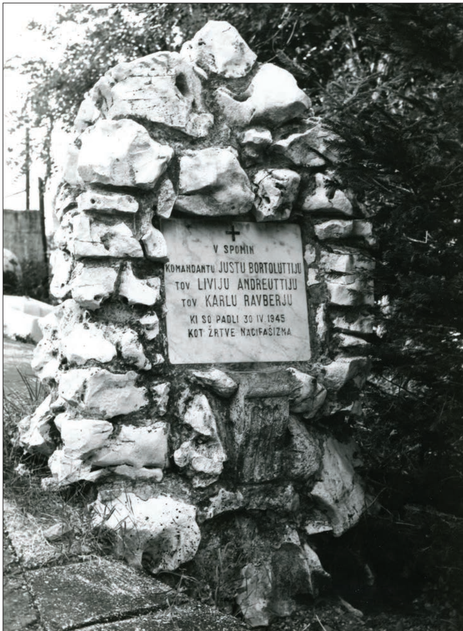
Slika 1: Spominsko obeležje na Trsteniku nad Trstom, postavljeno 30. maja 1945.