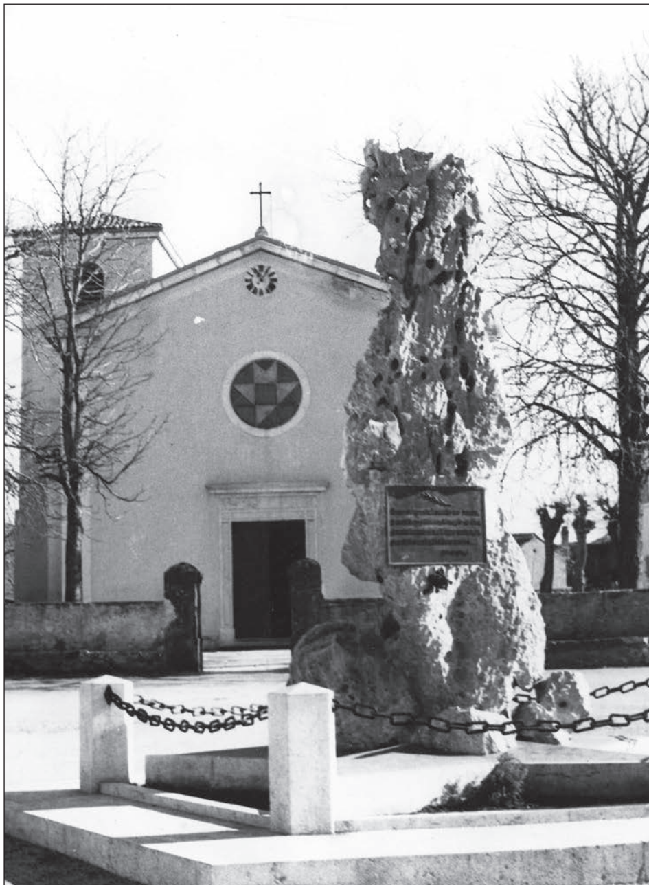
Slika 2: Spomenik na vaškem trgu v Trebčah.