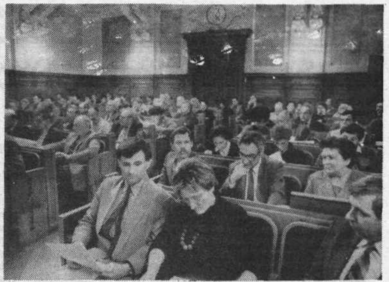
Programsko volilna seja občinske konference SZDL

Dovolite, da opozorim na nekaj temeljnih smernic naše občinske organizacije za dveletno obdobje: - bitka za stabilizacijo gospodarstva in bolj proti inflaciji, - utrjevanje in razvijanje političnega sistema s poudarkom na delovanju delegatskega sistema, - socialno ekonomski položaj občana in delavca, - krepitev in dosledno uveljavljanje vloge SZDL in njene organiziranosti (odprtost za najširši krog ljudi, predvsem mladih, metode političnega dela naj presežejo forumski način dela), - temeljni razvojni cilji naše občine za katere se bo treba boriti so: drobno gospodarstvo, turizem, gostinstvo, podpora ohranjanju vitalnih proizvodnih OZD v občini, stanovanjska gradnja in prenova, komunalna in prometna ureditev.