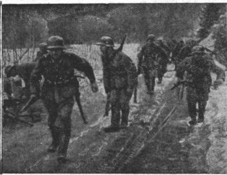
Levo: Na Norveškem so se Nemci pri svojem pohodu posluževali takih tankov. — Desno: Nemška pehota na ozki gozdni poti.