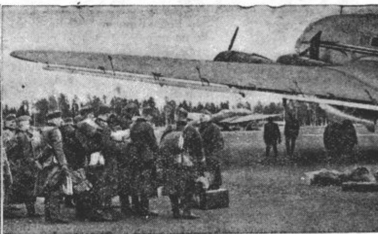
Levo: Na ozemlju za zapadnim bojiščem nadomeščajo živino ljudje. Desno: Zračni orjak na zapadnem bojišču