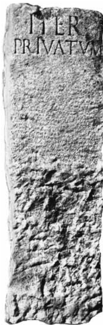
Sl. 1: Napisni kamen s Črnega pila pri Črnem Kalu. Museo civico di Storia ed Arte, inv. 13582. (Župančič, 1990, 20).

Dal che siano tratti a ritenere che l'ITER della lapida recentamente scoperta, sia di agro colonico e questo Agro pensiamo essere stato il Triestino che per l'asperità del secolo era assai esteso compensa colla estensione.