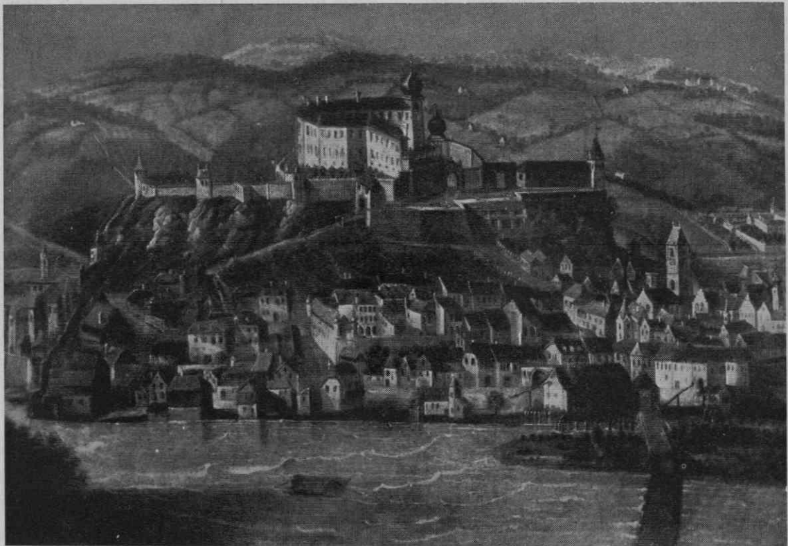
Ptuj z gradom okoli l. 1680—1700

Jedro sedanje dvonadstropne grajske podkve izvira iz tega časa. To jedro zajema juž-