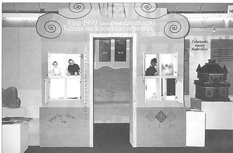
Stojnica SEM na 4. Slovenskem muzejskem sejmu v Cankarjevem domu (maj 1999).