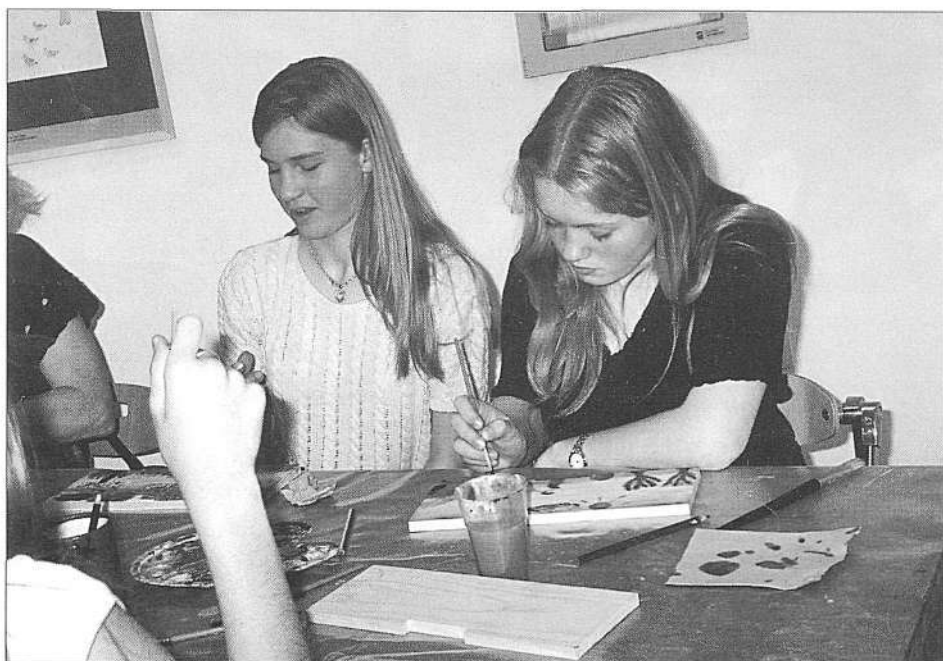
Poslikavanje lesenih deščic – panjskih končnic (foto S. Kogej Rus, maj 1999).