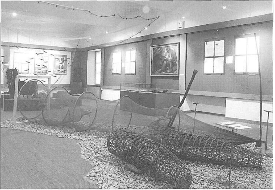
Razstava Vonj po morju, o slovenskem morskem ribištvu med Trstom in Timavo skozi stoletja (foto B. Mučič, marec 1999).