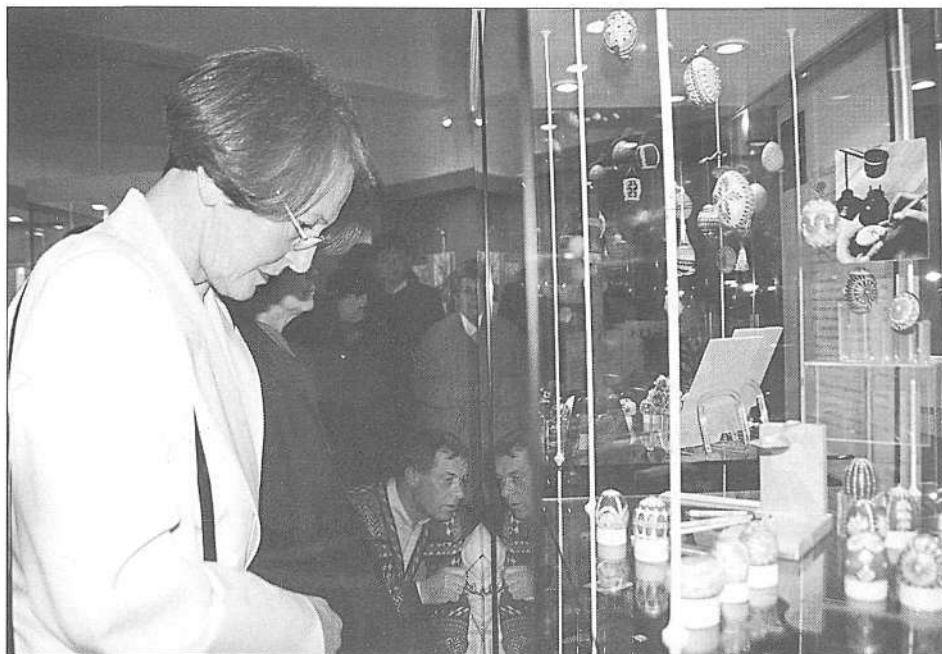
Odprte razstave Pisane kraslice, pirhi z Moravske (, april 1999).