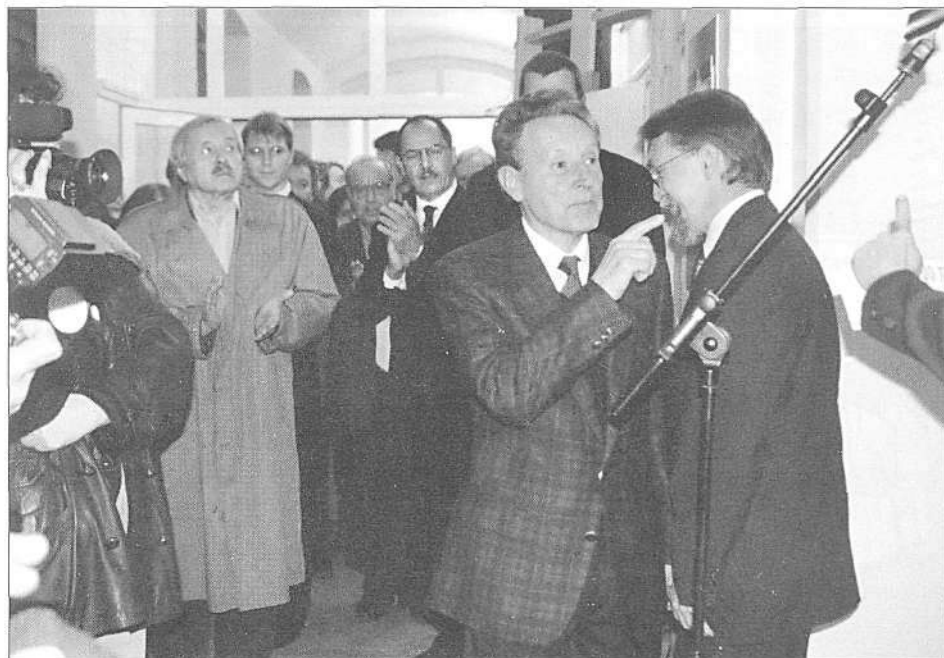
Odprtje razstave Vojn po morju, o slovenskem morskem ribištju med Trstom in Timavo skozi stoletja (foto B. Mučič, marec 1999).