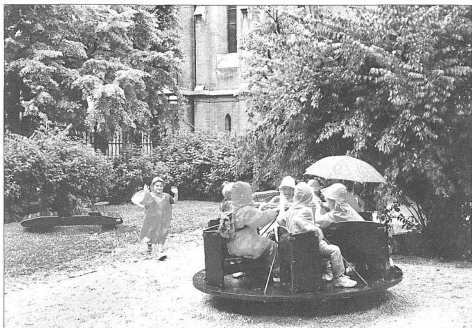
Muzejsko igrišče (foto S. Kogej Rus, junij 1999).