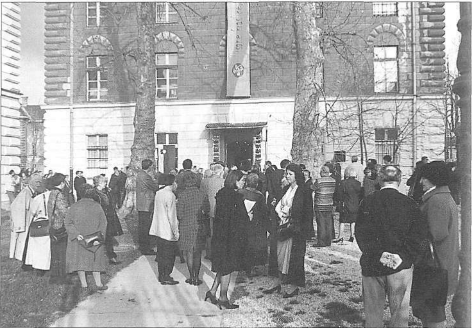
Odprtje razstave Pisane kraslice, pirhi z Moravske (foto B. Mučič, april 1999).