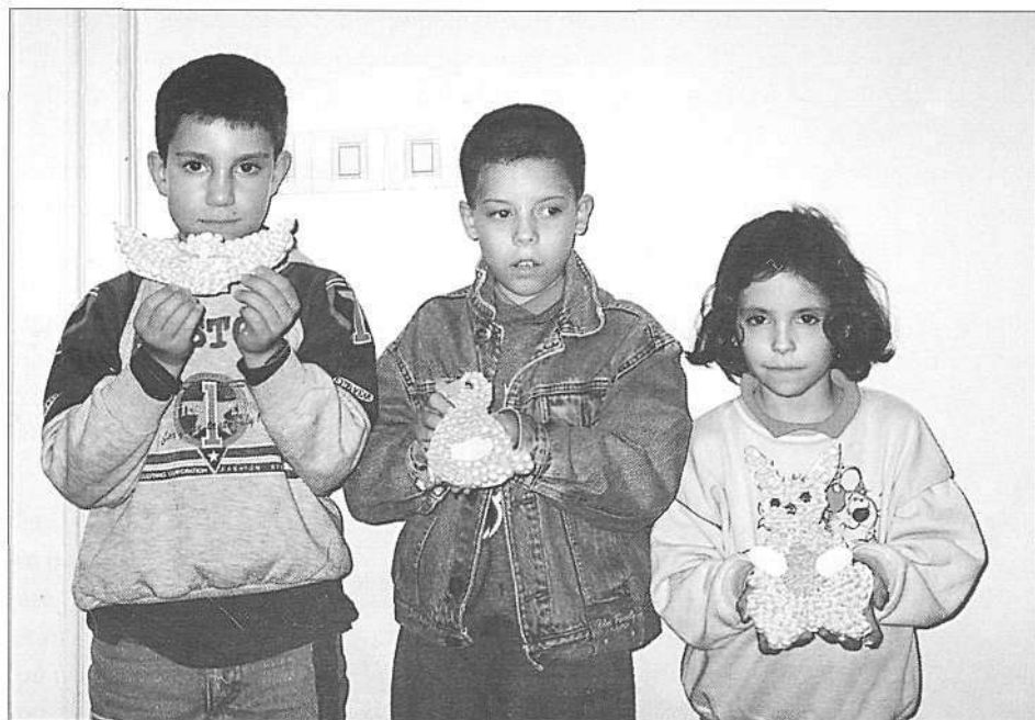
Delavnica izdelovanja živalic – velikonočnih simbolov (foto S. Kogej Rus, april 1999).