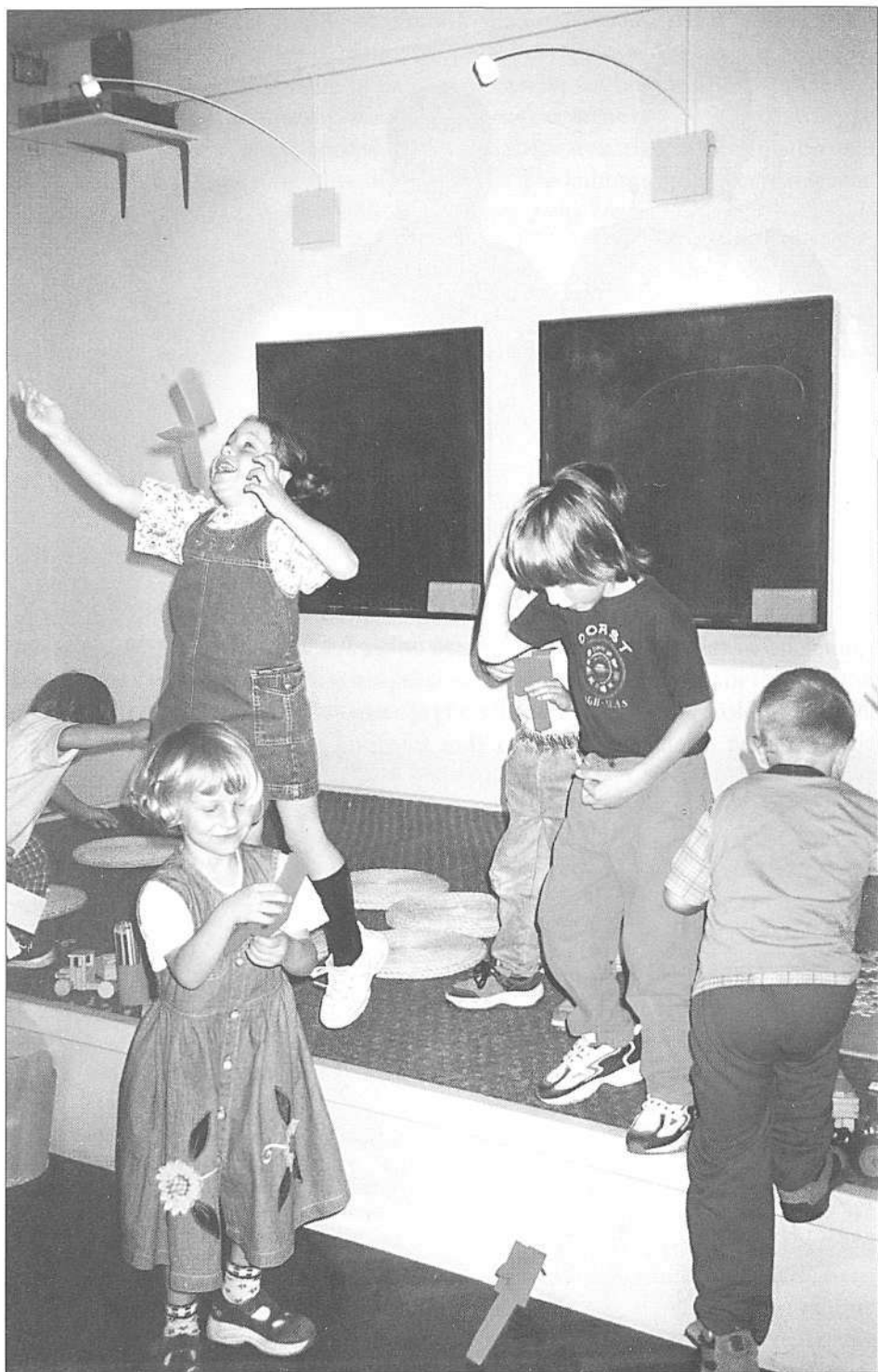
Igralnica na razstavi igrač (foto S. Kogej Rus, junij 1999).