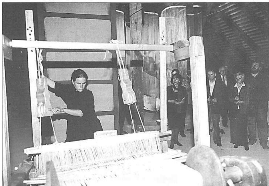
Odprtje prenovljene strehe razstavne hiše (maj 1999)