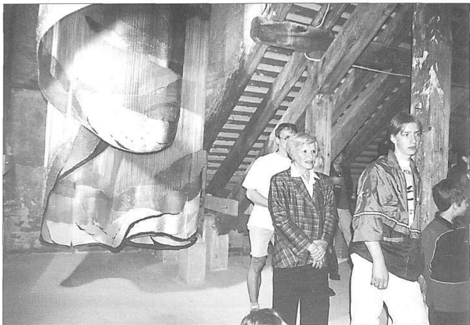
Odprtje prenovljene strehe razstavne hiše (foto B. Zupancič, maj 1999)