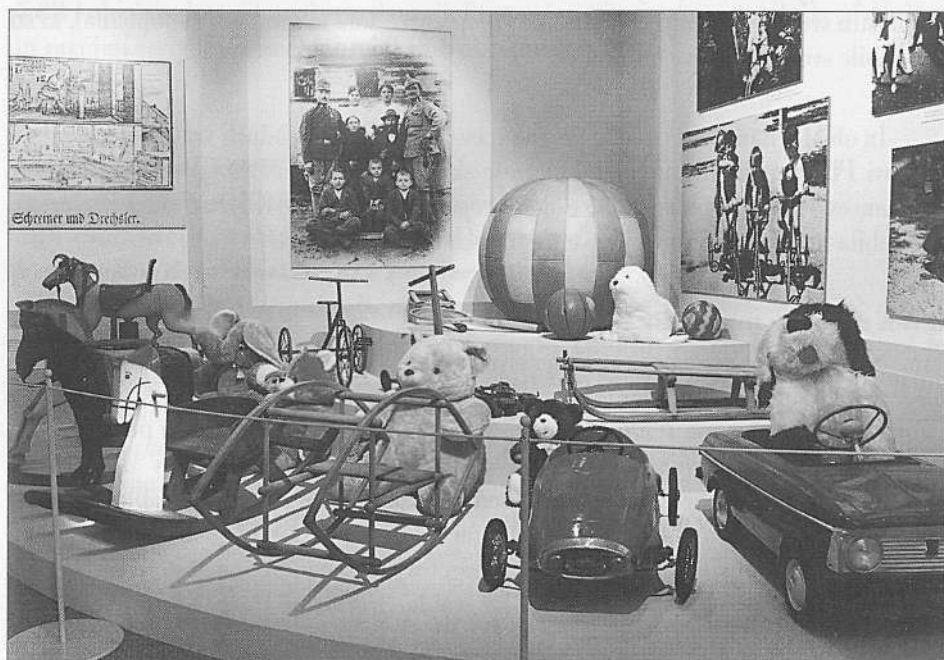
Razstava Igrače, stare in nove, moje in tvoje (foto B. Mučič, julij 1999).