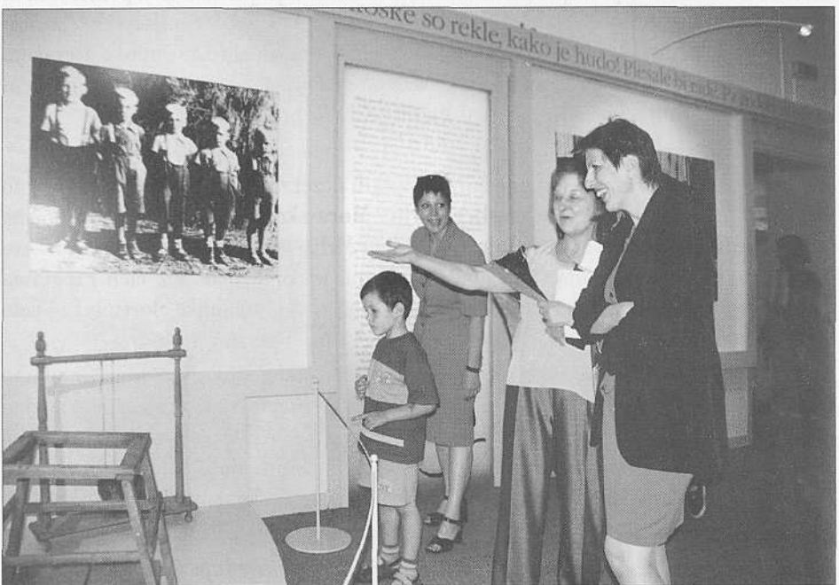
Odprtje razstave Igrače, stare in nove, moje in tvoje (foto B. Mučič, junij 1999).