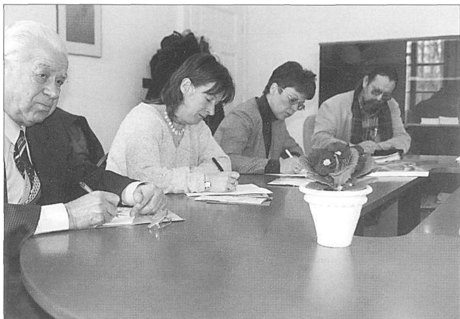
Tiskovna konferenca ob odprtju razstave Vojn po morju, o slovenskem morskem ribištju med Trstom in Timavo skozi stoletja (foto B. Mučič, marec 1999).