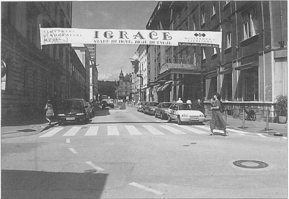
Transparent na Dalmatinovi ulici, ki vabi na razstavo Igrače, stare in nove, moje in tvoje (foto B. Mučič, julij 1999).