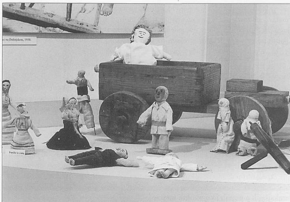
Razstava Igrače, stare in nove, moje in tvoje (foto B. Mučič, julij 1999).