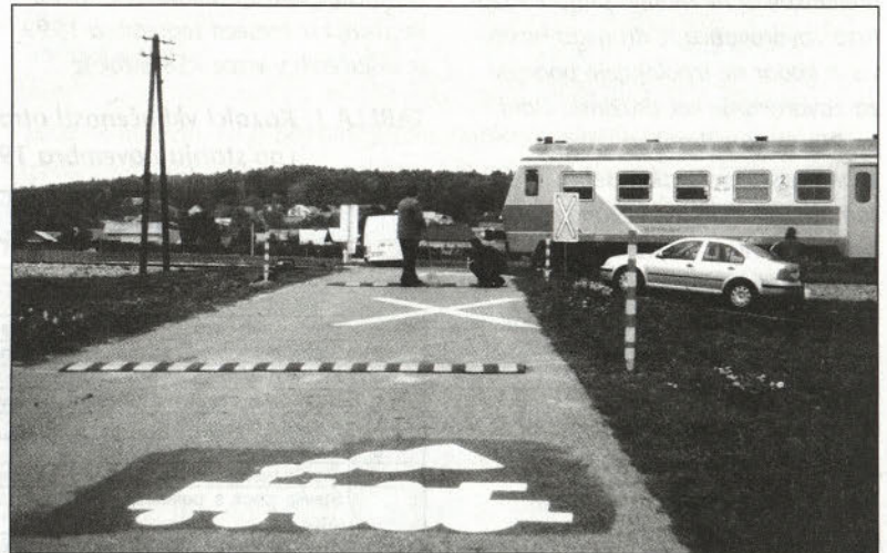
Železniški prehod v Podvincih, ki ga je Primotehna dodatno označila s količki, prometnimi znaki in hitrostnimi ovirami na cestišču.

na teh prehodih. Predstavniki Direkcije RS za železniški promet, Direkcije RS za ceste, Slovenskih železnic, Ministrstva za notranje zadeve, Generalne policijske uprave, Univerze Maribor, Inšpektorata za promet Maribor, Cestnega podjetja Ptuj, Sveta za preventivo in vzgojo v cestnem