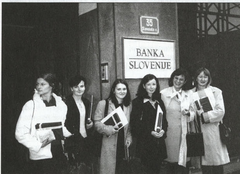
Mlade raziskovalke Ekonomske šole Ptuj z mentoricama.