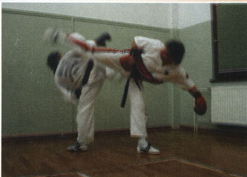
Priprava na tekmovanje

Ob praznovanju 25-letnice je ptujski klub v športni dvorani Center pripravil zanimiv prikaz borb in podelil priznanja najboljšim v posameznih kategorijah ter najzaslužnejšim športnim in strokovnim sodelavcem.