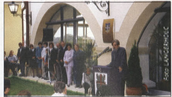
Ciril Zlobec, pesnik in akademik SAZU je zbrani množici iskreno povedal, da je ob vstopu v to knjižnico kar zijal.

koga še pozabil, kar bi bilo krivično. Zato čestitam vsem, ki ste sodelovali skoraj 15 let. V tem času smo opravili veliko delo. A pred nami je še večje. Projekt ptujška trojka je namreč prerasel v ptujško četvorko. Priključuje se posodobitev prostorov Gledališča Ptuj. Čaka nas še veliko dela. A skupaj bomo zmogli.«