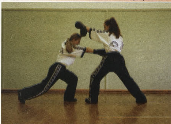
Utrinek iz borbe deklet, članic KBV Ptuj.

Glede na to, da imajo v primerjavi z drugimi razvitimi okolji le okoli 160 aktivnih pripadnikov, so