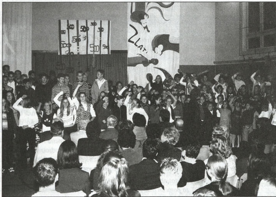
Šolska telovadnica je bila pretesna za 450 gostov in 140 nastopajočih.