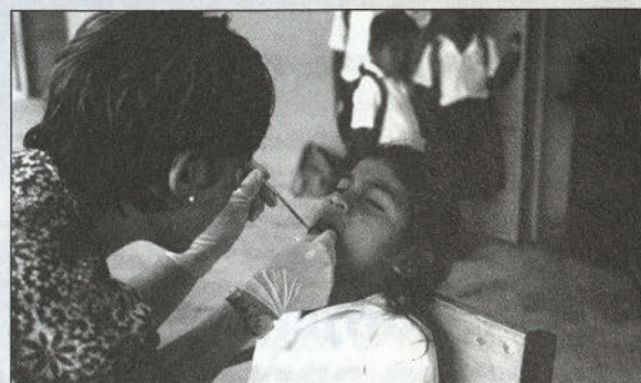
Naše zobozdravnice so kmalu ugotovile zelo slabo ustno higieno, saj so imele največ dela s puljenjem gnilih zob.

družin, da smo se seznanili z njihovimi problemi in poskušali pomagat po naših najboljših močeh. Glede na našo strokovno podkovanost smo največ postorili na zdravstvenem področju ter izvedeli veliko zanimivosti iz njihovega vsakdanjega življenja in verovanja v nadnaravna bitja.