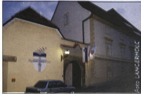
Vhod v obnovljeni Mali grad

namreč najvišji izraz pluralizma in demokracije, saj lahko v njej svobodno sežeš tako po Svetem pismu kot po Marxu in Engelsu ali Kardelju ... Vsaka knjižnica je biser v kulturni gumbnici mesta. Ptujška se imenuje po Ivanu Potrču, človeku, ki je bil ideološko jasno opredeljen, kar bi lahko bil tudi kamen spotike, a njegova neminljiva vrednost je v literaturi in ohranitvi lika tukajšnjega človeka, katerega podobo je vtisnil v zavest Slovencev. Potrč je izrazita figura v slovenski literaturi. Nazorsko in človeško opredeljen sodi v kritični realizem, med revolucionarne pisatelje. To, kar pomenita Miško Kranjec za Prekmurce, Srečko Kosovel za Kraševce, to je Ivan Potrč za tukajšnje prebivalce. Njegova vrednost ni v njegovi politični opre-