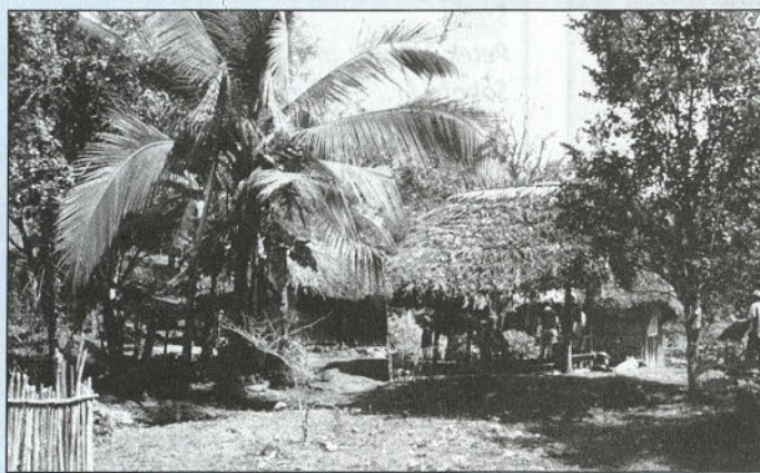
V vasi Teria v Panami živi približno 300 ljudi v lesenih hiškah, ki so razkropljene na precej velikem območju.

obiskuje 53 otrok. Poučujeta jih dva učitelja. Otroci so glede na starost razdeljeni v dva razreda. Preostala prazna učilnica je bila naš dom v času bivanja v vasi. Na tla smo položili tanke ležalnike, na njih razgrnili spalne vreče in razprostrli nujno potrebne mreže proti komarjem. Zjutraj so nas zbudili razposajeni otroci, ki so prihajali v šolo polni energije, čeprav večina izmed njih pešači do šole eno uro ali še več po ozkih poteh, ki so prehodne le peš ali s konjem.