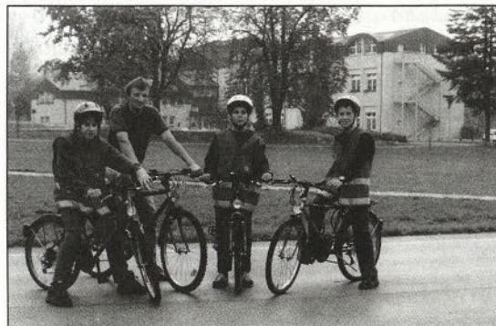
Na OŠ Ljudski vrt so na evropski dan brez avtomobila uspešno izvedli prihod v šolo s kolesi ali peš.

Povabilo je bilo med drugim naslovljeno tudi na tiste, ki načrtujejo in odločajo o porazdelitvi proračunskih sredstev (da bi jih v prihodnje name-