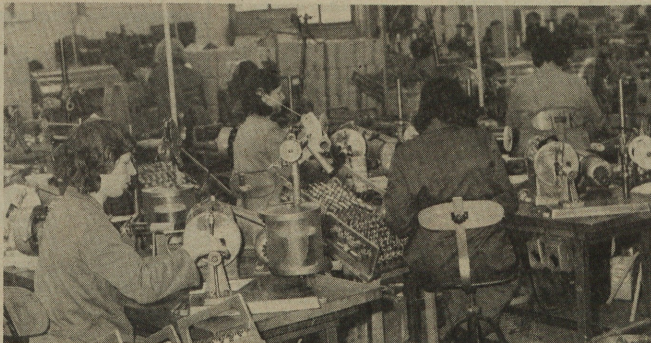
Iskra „Elektromotorji“ — Železniki je renomiran proizvajalec malih motorjev, ki jih kupujejo tudi v Nemčiji, ZDA, na Danskem, na Češkem, v Italiji. Slika kaže del oddelka kjer navijajo rotorje. Večina zaposlenih so ženske, ki jim za dan žena 8. marec, kot tudi vsem zaposlenim ženskam v Iskri, iskreno čestitamo k njihovem prazniku.

Družbeno-politične organizacije ISKRA—Raziskovalni institut so za 18. februar 1974 sklicale zbor delovnih ljudi, v obliki razširjene seje družbeno-političnih organizacij. Povabljeni so bili vsi člani sekretariata ZK, člani IO OOS, člani aktiva ZMS, delegati vseh samoupravnih organov, vodilni in vodstveni delavci in ostali člani kolektiva.