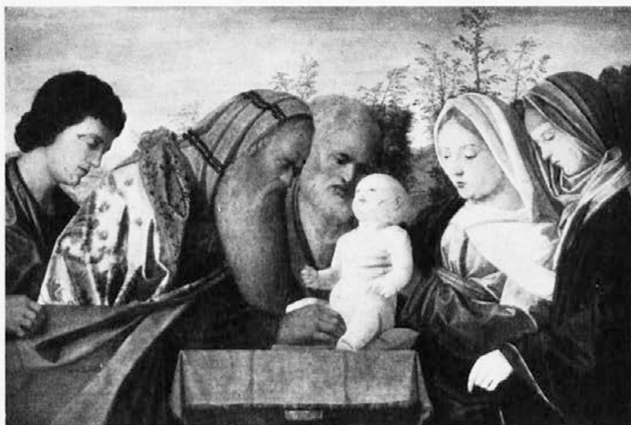
Sl. 182. Sljedbenik G. Bellinija, Obrezanje Isusa (New York, Metropolitan Mus.)

»Obrezanja« vežu s ostalim njegovim djelima. Dovoljno je pogledati njegove slike u Accademiji u Veneciji, na pr. Madonu s djetetom, Krunjenje sv. Katarine, Sv. Konverzaciju ili Mrtvog Krista među anđelima: 9 to je ista mekoća nabora i bezizražajnost fizionomija kao na zagrebačkoj slici. No još izravnije uporište pružit će nam Bissolovo »Prikazanje Isusa u hramu« (sl. 181) iz iste galerije. 10 Lik Sv. Josipa koji se nalazi između djeteta i svećenika, to je upravo lik sa zagrebačke verzije »Obrezanja«,