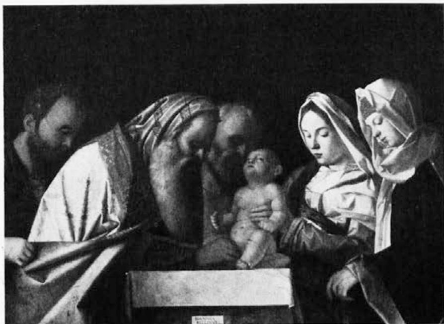
Sl. 180. Giov. Bellini (?), Obrezanje Isusovo (London, Nat. gal.)