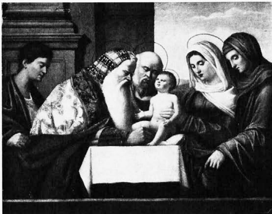
Sl. 179. Franc. Bissolo, Obrezanje Isusa (po G. Belliniju, Zagreb, Strossmayerjeva gal.)

U svakom slučaju bila londonska verzija Bellinijev autograf ili ne, od njegove invencije »Obrezanja Isusova« potječe ne samo naša varijanta, nego i cio niz ostalih, koje se nalaze u različitim zbirkama i galerijama. 7 Neke od njih bile su sasvim neosnovano pripisivane Cateni (u Galeriji Doria, u Napulju, u New Yorku, u Paviji). Robertson odriče sve te atribucije. 8 Što se zagrebačke verzije tiče, A. Schneider u svom