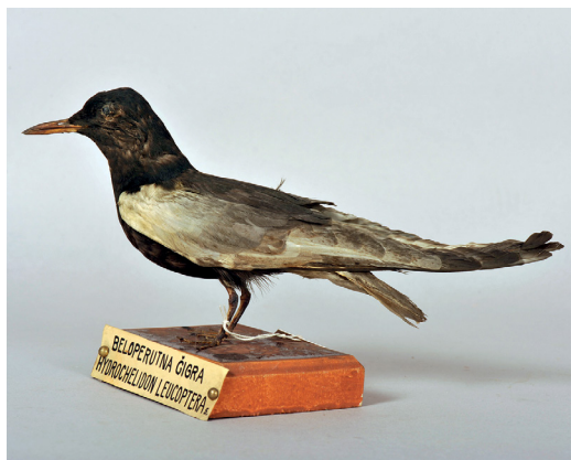
Slika 11: Dermoplastika beloperute čigre Chlidonias leucopterus , ad. Primerek PMSL 5417, zbran pred letom 1868.

Beloperuta čigra sodi med dvomljive slovenske gnezdilke, saj je bila kot taka v preglednih seznamih gnezdilke navedena, nikoli pa gnezditvev tako ali