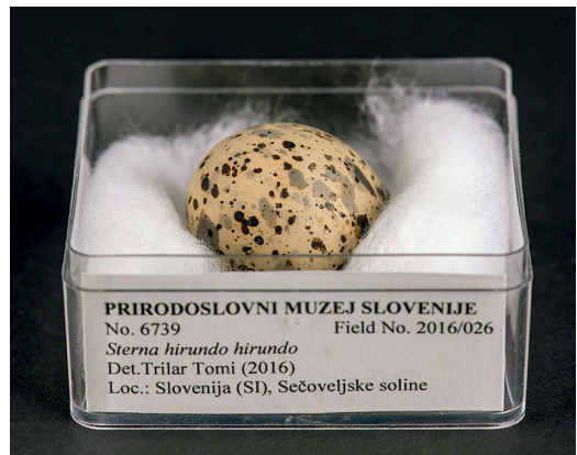
Slika 8: Jajce navadne čigre Sterna hirundo iz Sečoveljskih solin, ki ga je zbral in prepariral Tomi Trilar. Primerek PMSL 6739, zbran leta 1987.

Sloveniji znana gnezdilka rečnih prodišč (REISER 1925, PONEBŠEK & PONEBŠEK 1934). V zbirki PMS so shranjena jajca navdanih čiger, zbrana v kolonijah v Sečoveljskih solinah, Škocjanskem zatoku in na Ptujskem jezeru v recentnem obdobju (Slika 8).