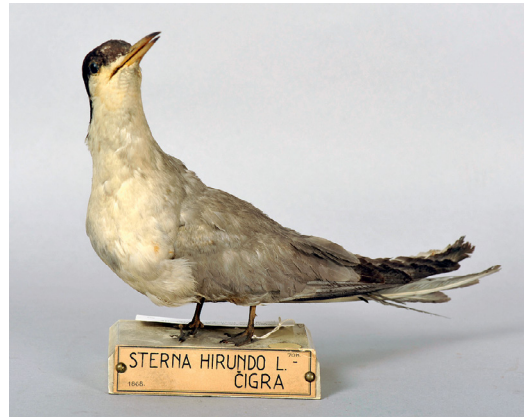
Slika 7: Dermoplastika navadne čigre Sterna hirundo , ad. Primerek PMSL 4945, zbran pred letom 1868.

Navadna čigra je redna gnezdilka Slovenije tako v celinskem kot obalnem delu države (DENAC s sod. 2019). Trenutno znane kolonije so v Sečoveljskih solinah, Škocjanskem zatoku, ob spodnji Savi in ob reki Dravi, morda pa je bila nekdanja njena razširjenost večja po rečnih prodiščih, kjer danes ne gnezdi več. V zbirki PMS je navadna čigra zastopana tako s primerki iz Slovenije kot iz drugih območij v JV Evropi (Hrvaška, Srbija). Najstarejši ohranjeni primerki je dermoplastika odraslega osebka, ki je bil pridobljen pred letom 1868, vendar natančna provenienca ni znana, čeprav zelo verjetno izvira iz Slovenije (Slika 7). Med starejšimi primerki zbuja pozornost ptice, zbrane ob Savi pri Ljubljani v spomladanskem in poletnem času, ko je vrsta na savskih prodiščih morda celo gneznila, saj je bila vrsta v