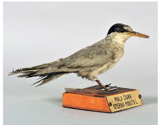
Slika 5: Dermoplastika male čigre Sternula albifrons , ad. ♂. Primerek PMSL 5416, zbran pred letom 1868.

Mala čigra sodi med občasno ugotovljene gnezdilke (VREZEC 2019). V zadnjih 50 letih je redno gnezдила le v Sečoveljskih solinah, gnezdenje v celinskem delu Slovenije pa je bilo občasno, maloštevilno in lokalno (GEISTER 1995, ŠKORNIK 2019). V zbirki PMS je ohranjenih več primerkov, z ohranjenimi podatki pa le eden. Slednji je zanimiv kot verjetni gnezditveni podatek s savskih prodišč v Stožicah