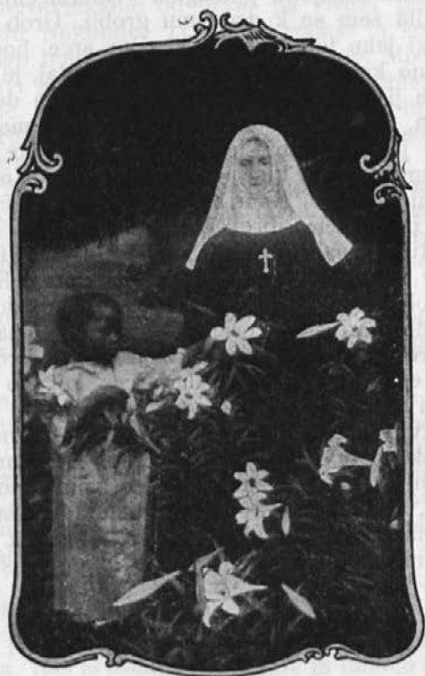
Koleta je bila podobna liliji . . .

Viktorija, ki je bila velika in močna, je mnogo delala na polju, vrtu in otroški kuhinji. Ob deževnih dneh, ko ni bilo za na polje ali za v vrt, je opravljala ročna dela doma. Zнала je plesti lepe preproge iz slame in modelirati umetne vaze, lončke in svečnike iz ilovke. Vse