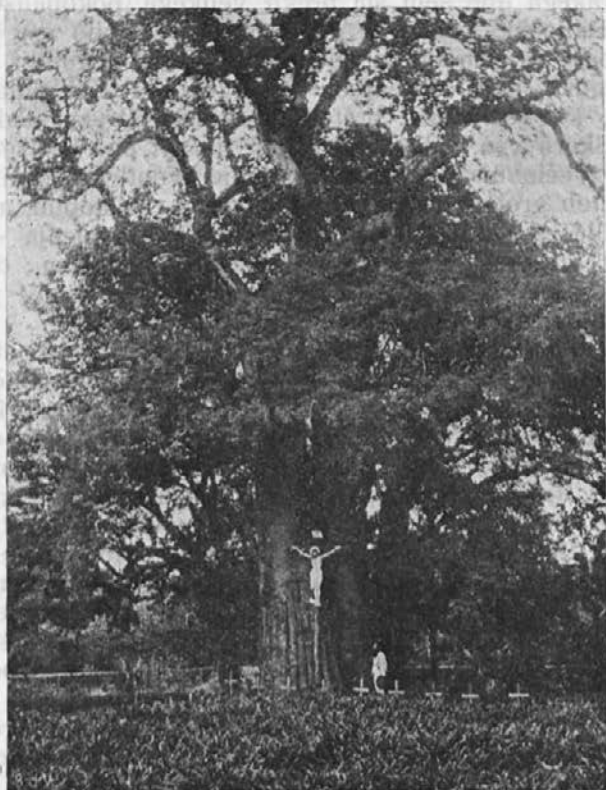
Del pokopališča v misijonu Katonda.