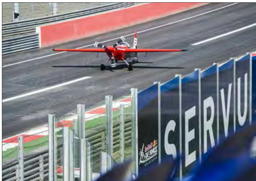
Pristanek na stezi dirkališča v Spielbergu

Ventil: Zahvaljujemo se vam za vaše odgovore, vam in vaši ekipi želimo še veliko uspešnih tekmovanj, mladim