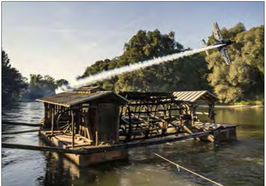
Letenje nad Muro

Ventil: Kako je v Red Bull Air Race poskrbljeno za varnost pilotov tekmovalcev? Kako so urejeni odnosi med piloti in organizatorjem tekmovanja? Ste zavarovani za primer nesreče, poškodbe, smrti?