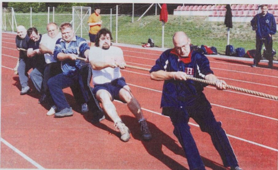
Najbolje so potegnili fantje iz Slovenj Gradca.