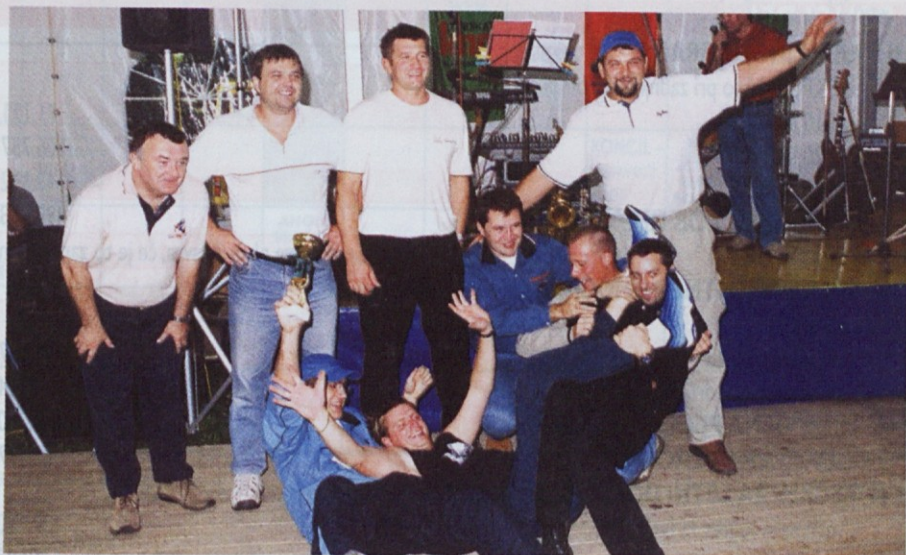
Hrastniški steklarji, najboljši pod koši, so zmago takole proslavili.