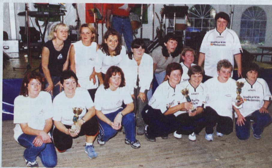
Najboljše kegljavke so bile po borbenih igrah zelo nasmejane.