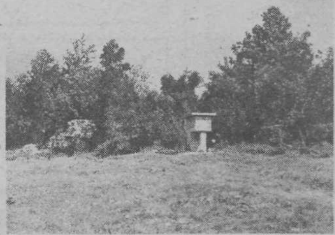
Pugled na Kočevskem, kjer je bil od 27. do 30. aprila 1943 zbor aktivstov OF, ki so potrdili dolomitsko izjavo.