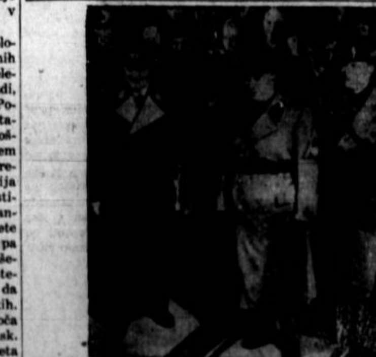
General Hermann Goering (levo), nacijski minister letalstva in italijanski diktator Mussolini, ki sta se nedavno sestala v Rimu.

Posebno poglavje je rastoča brezposelnost starejših žensk. Po statistiki iz Anglije iz leta 1935 je 39% registriranih brez-poselnih žensk nad 35 let starih. Podobno je v Kanadi, Zedinjenih