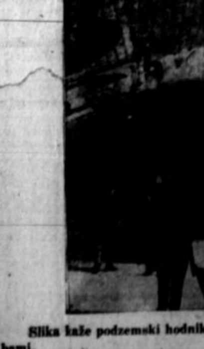
Slika kaže podzemski hodnik v Madridu, kjer prebivalci iščejo zavetje pred fašističnimi bombami.

Topeka, Kans., 17. febr. — Kansaški državni senat je te dni ratificiral amandment za odpravo otroškega meznega dela. Glasovanje je izpadlo 20 za in 20 proti, toda predsednik senata je odločil v prid amandmentu. Glasovati ima še nižja zbornica in če tudi ta ratificira, kar je upanje, bo Kansa osemindvajseta država na ratifikacijski listi. Kentucky, Nevada in New Mexico so letos že odobrile ta amandment. Potrebnih je še devet držav.