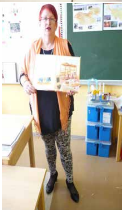
Slike 5, 6, 7, 8, 9: Izvajanje biblioterapije s pomočjo Andersenove pravljice z naslovom Cesarjeva nova oblačila v okviru bibliopedagoških ur na Dvojezični osnovni šoli I v Lendavi.