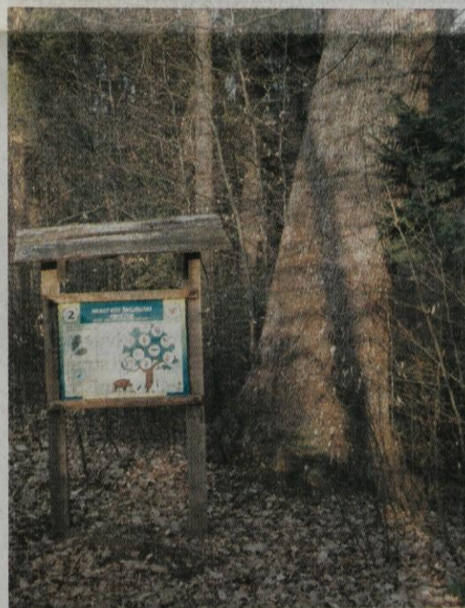
Table opozarjajo, da česa ne spregledamo - v tem primeru je to eden največjih hrastov ob poti.