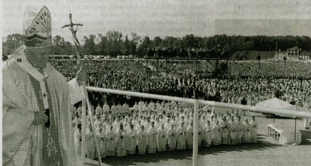
»Danes sem tukaj med slovenskim ljudstvom v Ljubljani, v 'beli Ljubljani' kot romar in glasnik evangelija.« Papež Janez Pavel II. pri maši ob 1250-letnici krščanstva na Slovenskem, 18. maja 1996 v Ljubljani.