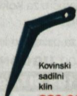
Kovinski sadilni klin 330,00 SIT