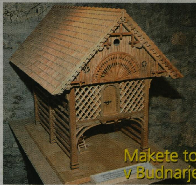
Makete toplarjev v Budnarjevi hiši

Vrbančev toplar iz Motnika. Vsi ljubitelji dediščine ga dobro poznajo, občudujejo, saj je z letnico 1897 pomemben del stavne dediščine v naši občini. Njegova posebnost je edinstvena pahljačasta rozeta na čelu kozolca. VERA MEJAČ