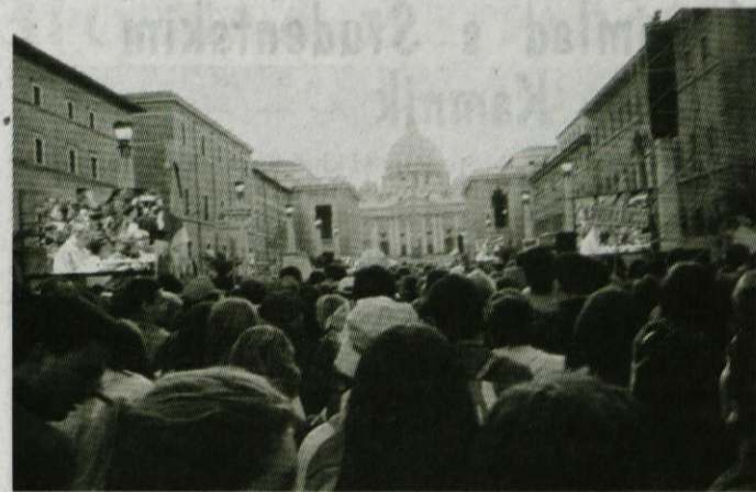
Bazilika Sv. Petra - tako blizu, a še nekaj ur daleč...