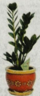
Lončnica ZAMIJA, lonček Ø12 990,00 SIT* *Lonček ni vključen v ceno.