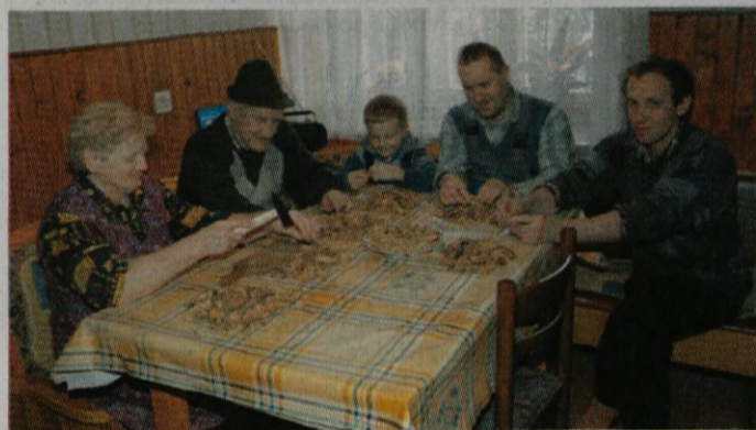
Eno prijetnejših opravil je trenje orehov, česar se kar družno lotijo v topli kuhinji ob kmečki mizi.