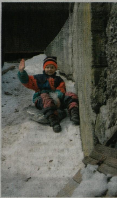
... nato pa si je vzel zaslužen čas za igro in se spustil na vrečki sena po svoji »bob stezi«.

Ob razmišljanju, kako težko sta starša preživela in spravila h kruhu šest otrok, mama pojasni: »Saj jih nismo nič krkljali, so v revščini gor zrasli, tako kot mi«. Do leta 1995 so na njivah delovali ajdo, pšenico, ječmen, oves, proso, koruzo, krompir, korenje, kolerabo, repo, pesa... Vsako leto zredijo osem prašičev, tri za zakol, druge pa prodajo. V hlevu imajo povprečno petindvajset glav goveje živine iz domačega prirastka, kupijo le