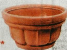
Skleda pihana plastika, Ø 45 cm 1.999,00 SIT