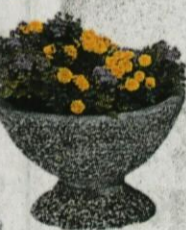
Prano korito PEHAR, 49x30 cm UGODNO