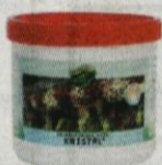
Gnojilo za balkonske rože kristal (N-P-K; 16-9-26+Me), 500 g 499,00 SIT