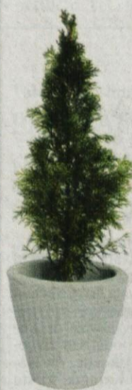
Živa meja THUJA SMARAGD, višina 40-60 cm 1.199,00 SIT* *Lonček ni vključen v ceno.