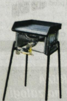
Plinski žar GRILL 300 KOMBI 19.990,00 SIT