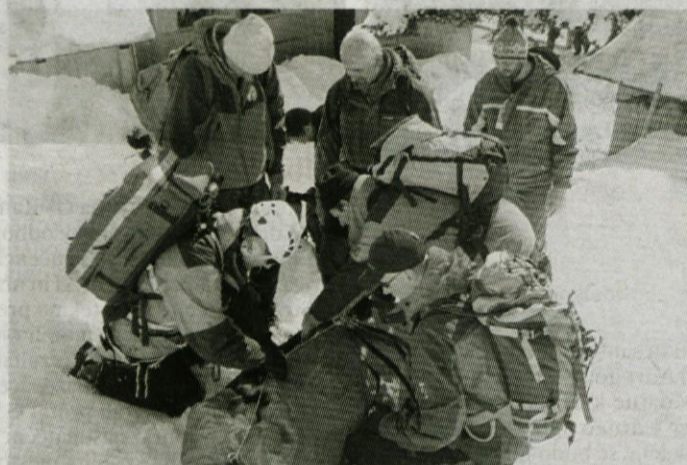
Tudi na Veliki planini se pogosto zgodi nesreča. Priprava ponesrečenke na prevoz.

Poleg tega je bilo na občnem zboru tudi precej razprave o sprejemu novih članov. Število članov postaje je sicer večje, kot predpisuje standard, vendar je njihova