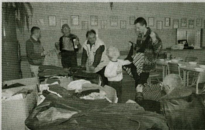
... in še povsem uporabnimi, lepo ohranjenimi oblačili.

Humanitarno društvo Slovenije želi s skupnimi močmi reševati problematiko lačnih, ubogih,