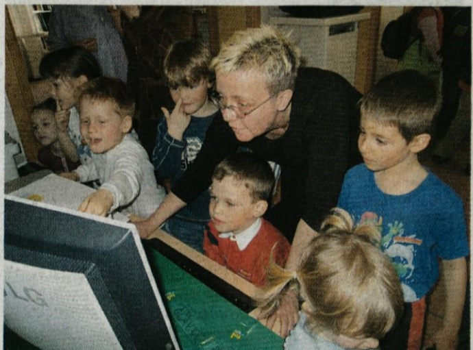
Tušev bistri koticček je kaj hitro zapolnila otroška radovednost, mladi nadebudneži so bili zavzeti iskalci novih računalniških znanj.

Malčkom bodo predstavili Tušev bistri koticček, kjer bodo s pomočjo računalniške opreme