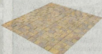
Tlakovci Romanika MIX 2090,00 SIT / m 2