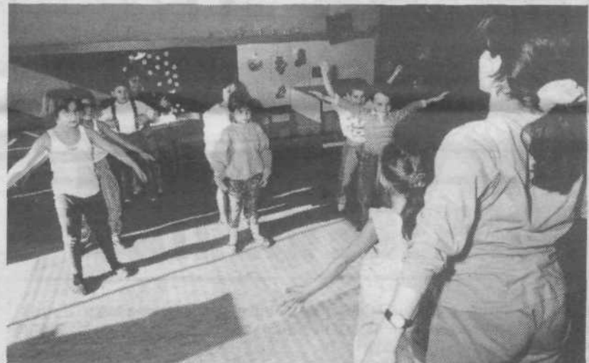
Vrtec Angelce Ocepek ima enoti tudi v Novih Fužinah in na Selu

Pričakovanja staršev so bila nekako izpolnjena v trenutku, ko je bil otrok sprejet