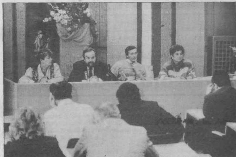
Izvršni svet in sekretariat občinske skupščine sta 5. novembra 1993 organizirala posvet o novi lokalni samoupravi