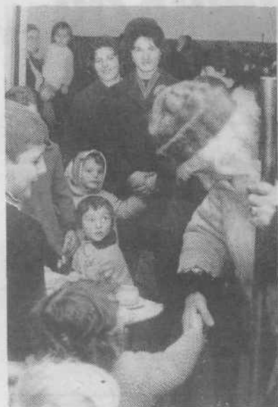
Dedek Mrav v VVZ Angelce Ocepek leta 1970

šolarji« naučili plavati, osvojili veččine na smučeh, kolesu, drsalkah, kotalkah.