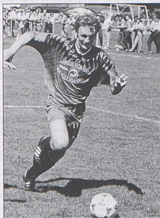
Pasterk in co. bodo jeseni tek- movali zopet v 1. razredu.

Športno uredništvo NAŠEGA TEDNIKA Globasnici za naslov prvaka prisrčno čestita!