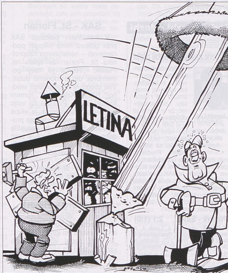
Medtem ko so Letinčani gasili žejo, so jim Dobljani „zabili“ vrata in porezali mlaj...

Šmihel. Šmihelski čebelarji praznujejo letos 75-letnico čebelarstva društva Šmihel. V sboto, 24. maja, se bodo čebelarji dopoldan peljali v čebelarški muzej v Kožentavro, ob 12. uri pa je doma v gostišču Juenna čebelarstva slavnost, na kateri pričakujejo tudi predsednika čebelarjev Slovenije prof. Lojzeta Peterleta.