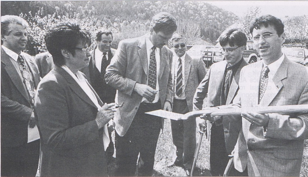
90 mio. šilingov bo stal novi dodatni dom za upokoјence v Podlazu (Pudlach) v občini Suha. Pri slavnostnem pričetu gradnje je bila navzoča večina županov iz okraja Velikovec.