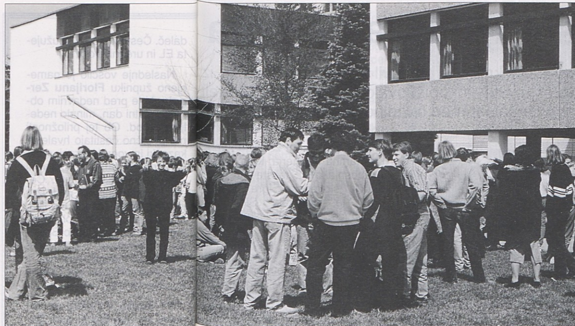
V nedeljo praznuje Slovenska gimnazija s slavnostno akademijo svojo 40-letnico obstoja.