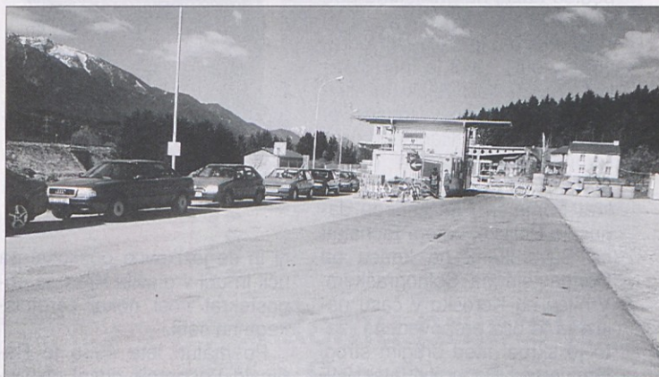
Mednarodni mejni prehod Holmec dobiva čedalje večji pomen. S tem povezan je tudi večji promet iz Slovenije v Avstrijo. Most čez Dravo pa bi bil važen prometni del evropskih cestnih zvez.