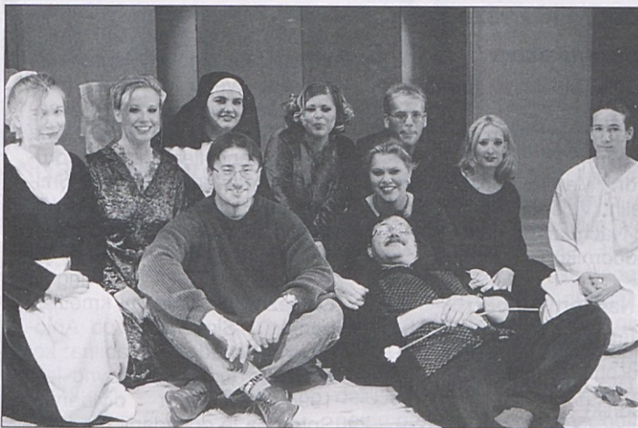
Šmihelska gledališka skupina si je letos izbrala zelo zahtevno igro.