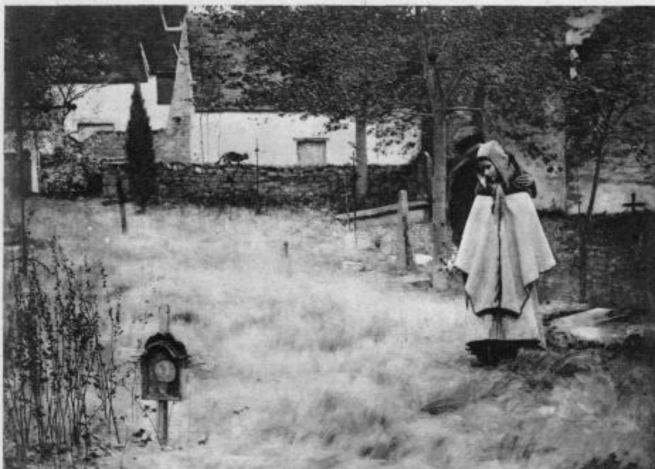
Partiz. Luksemburški muzej.

Elizabeta pa se je naredila kakor človek, ki ne vidi in ne sliši in nima v ustih zopergovora. Vsa strta v prvem trenutku,