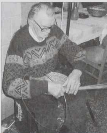
Vidite, tak se dela krbüla

steri je ovak pa več biu ka goščice lüpanje. Tau je delala tak naskrivoma, ka smo se rejsan presenetili (meglepödtünk), gda smo prišli večer v petoj vöri k Cifri, kama nas je zvala. Že na