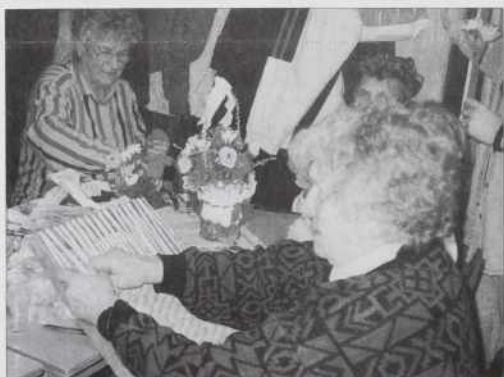
Flajsne ženske roke

Te smo začnili plesati, tak ka se je vse prašilo. Samo so tej kartaške pa ženske nej tak njale svojo delo. Ženske so tačas sükale pa baužale kreppapire, ka je naslednja eden lejpi košar bio vöpostavljeni. Dajte mi valati, ka je veselo bilau. I.B.